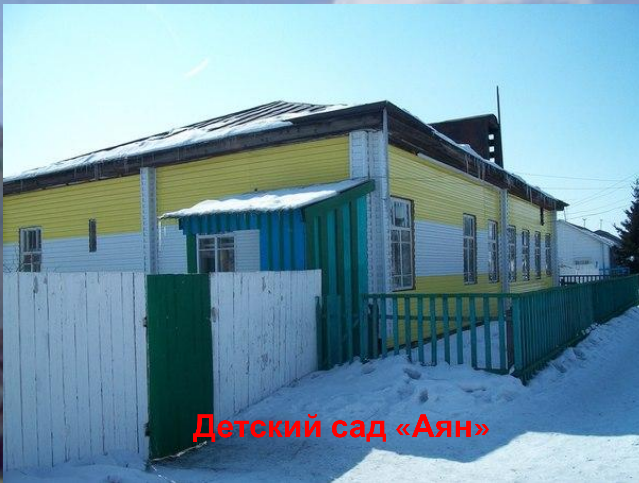
Детский сад «Аян»

Мы выбираем. Нас выбирают. Как это в жизни не совпадает. Только в жизни так совпало, Что неразлучен я с детским садом.