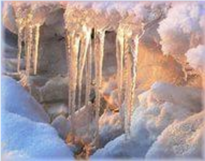
Оттепель-временное таяние снега зимой, ранней весной