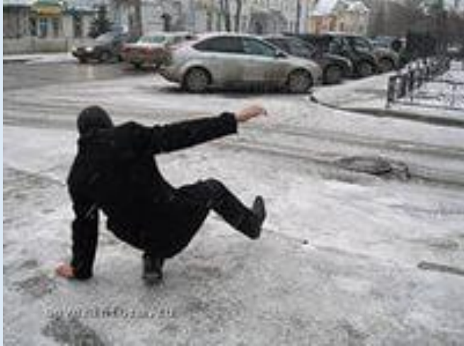
Гололёд- слой плотног стекловидного льда