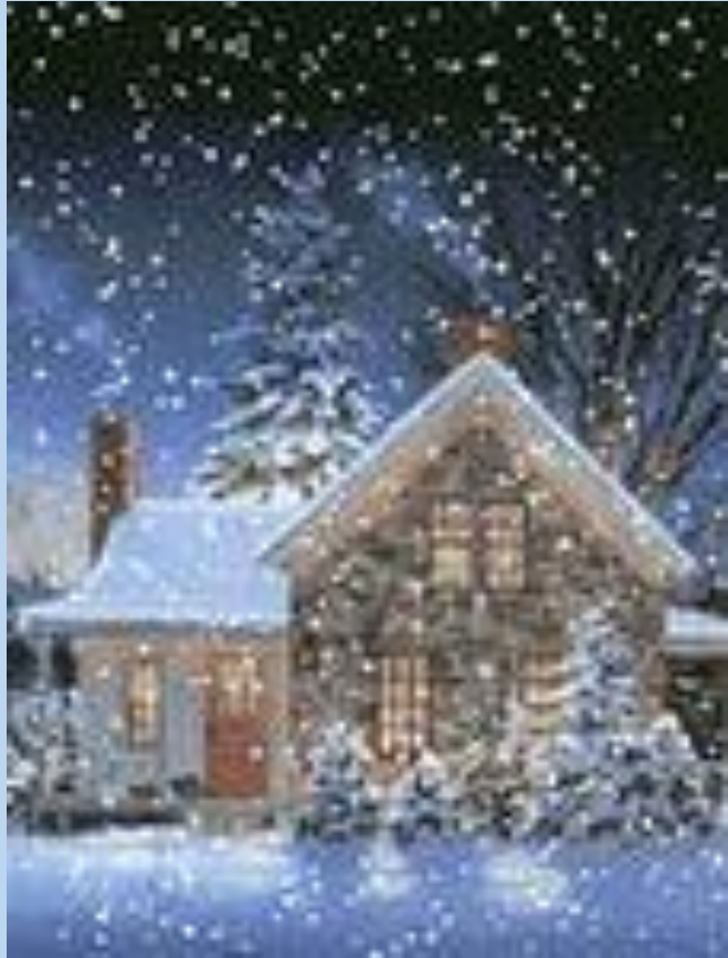
Снегопад- выпадение снега из облаков

Вьюга-перенос снега ветром в приземном слое воздуха