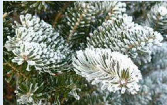
Иней-тонкий слой ледяных кристаллов образующихся из водяного пара атмосфер