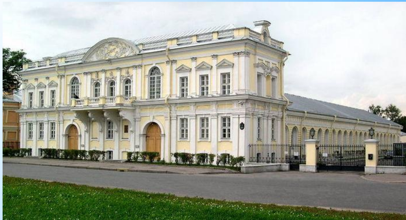
МАНЕЖ ПЕРВОГО КАДЕТСКОГО КОРПУСА