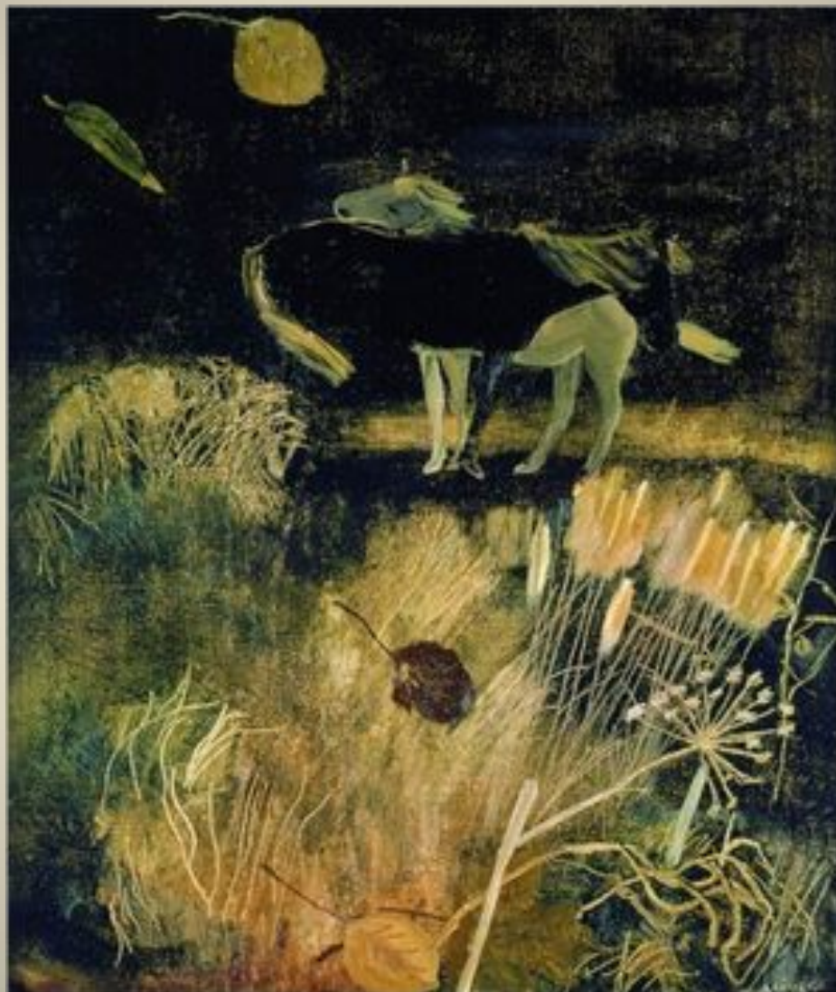
А.А. Дейнека. Ночной пейзаж. Масло.