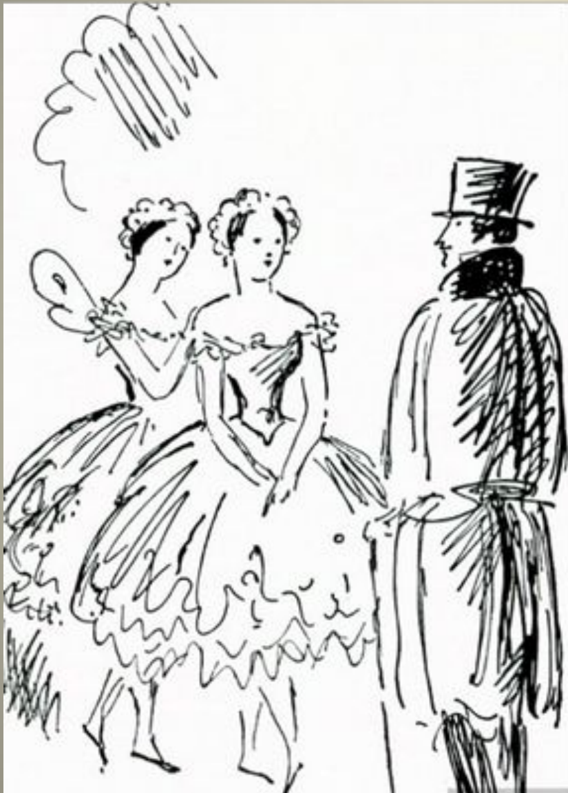
Рисунок пером или карандашом в основном состоит из линий – длинных или коротких. Волнистых или отрывистых, толстых или тонких. Линии разные по своему характеру.

Иллюстрации к роману А.С.Пушкина «Евгений Онегин». Тушь.