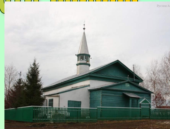
Вид старой мечети села Бурундуки