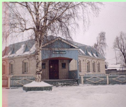
Музей Галии Кайбицкой