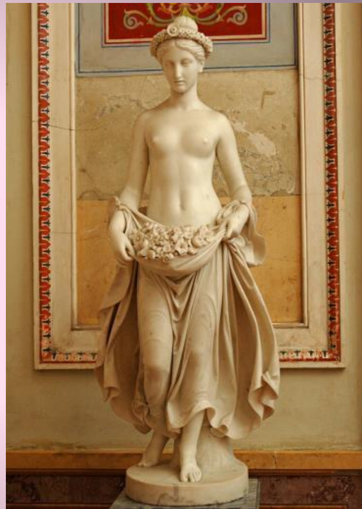
Флора. Пьетро Тенерани (1798—1869). Мрамор. 1840 г. Эрмитаж.