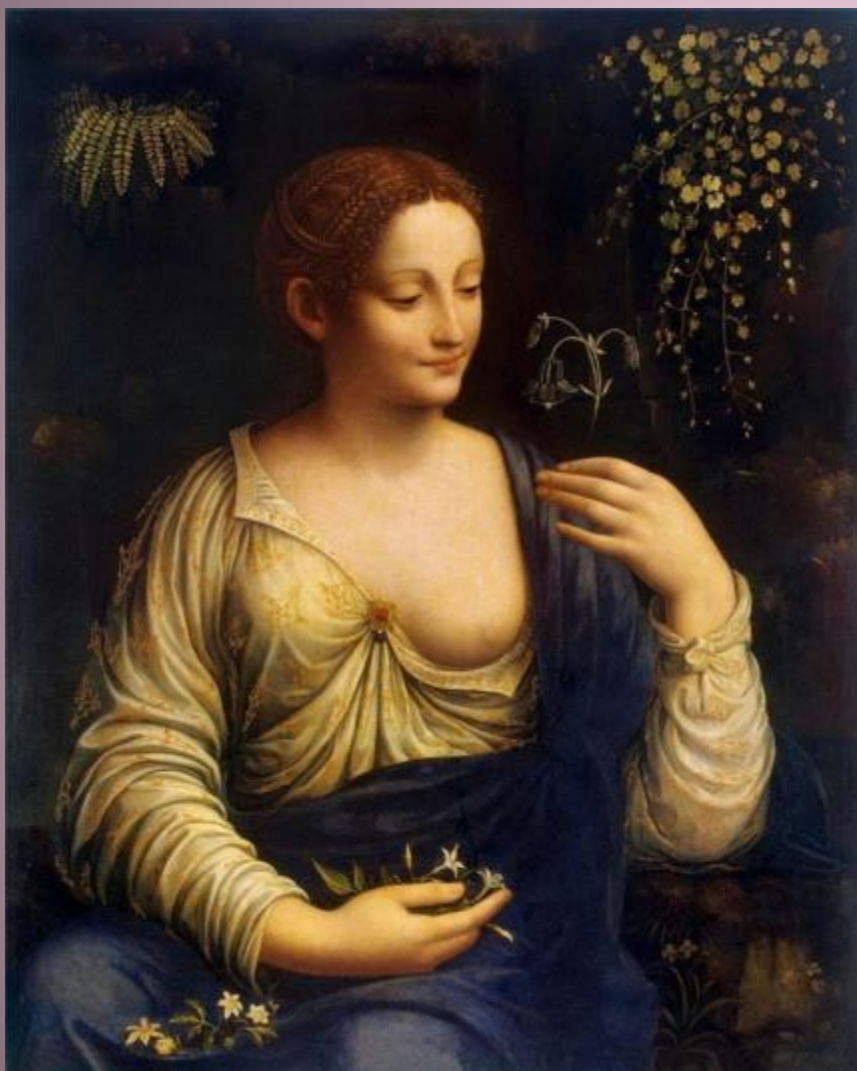
Мельци Франческо. Флора, 1520.

В честь богини были установлены празднества (с 28 апреля по 3 мая) — Флоралии. В эти дни на ее алтарь возлагались цветущие колосья. Все участники празднеств украшали себя и животных цветами, одевались в яркие одежды.