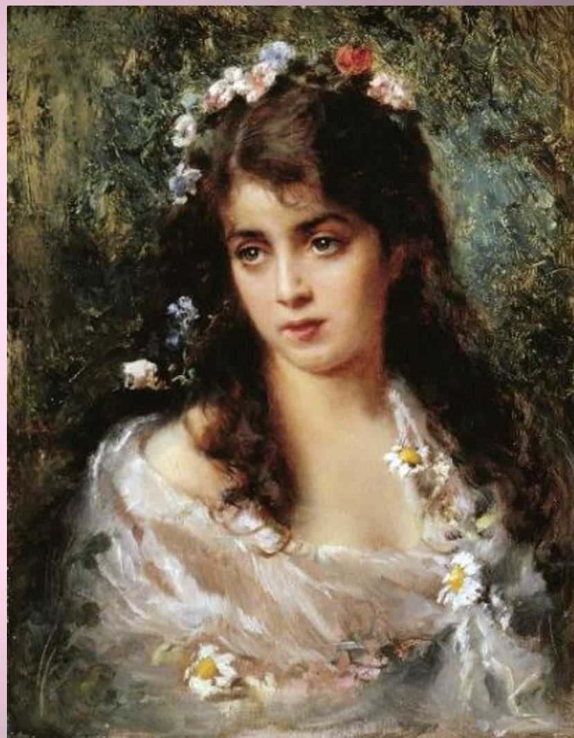
К. Маковский. Девушка в образе Флоры.