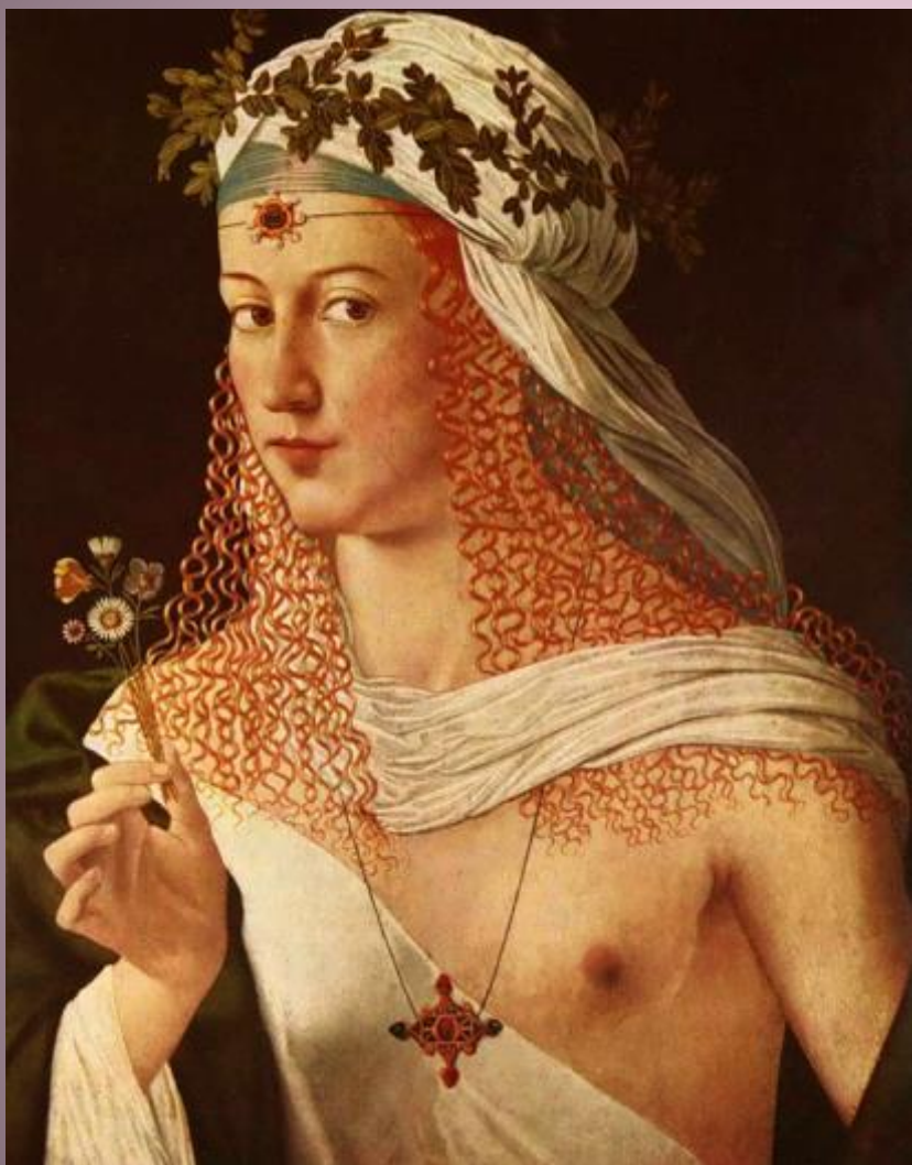
Бартоломео Венето. Флора.