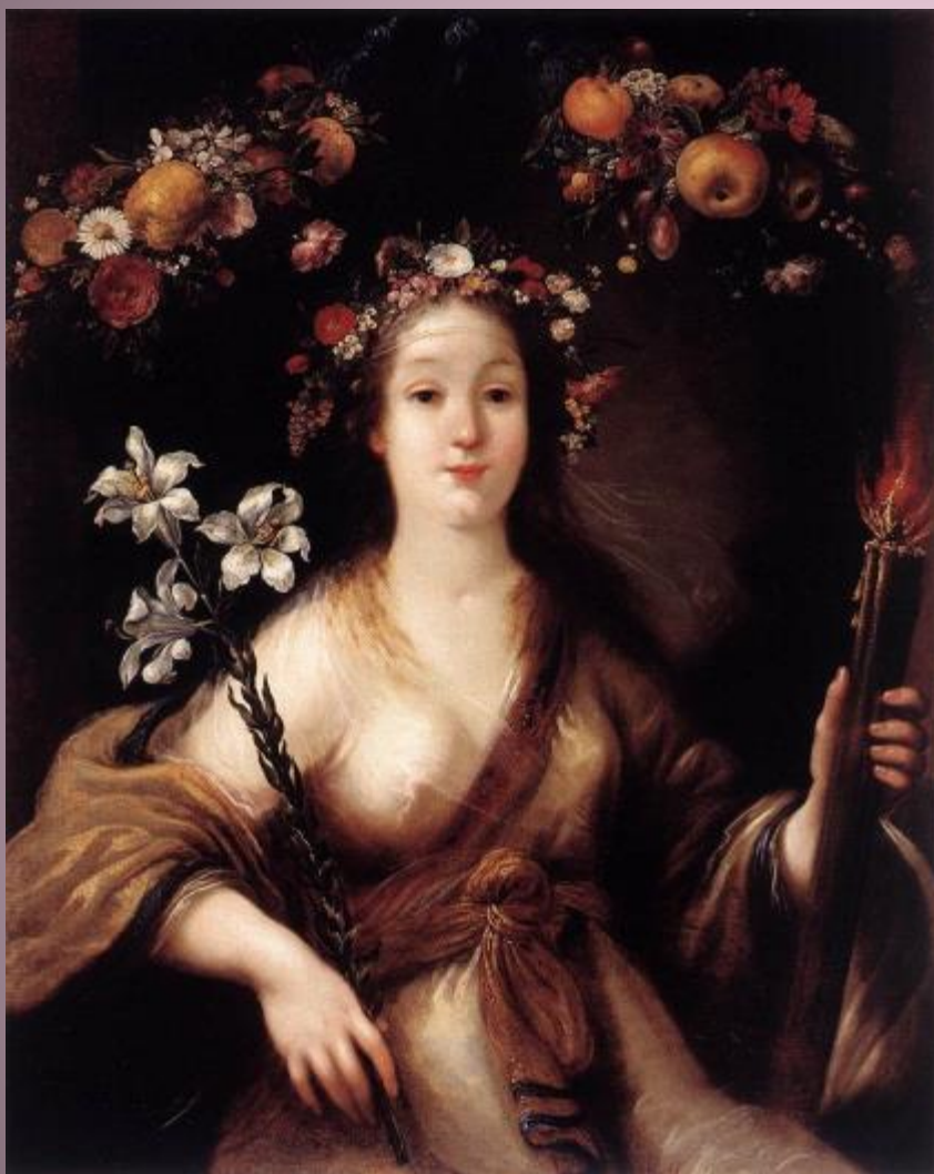
Виньон Клод. Флора.