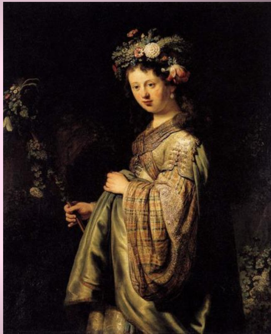
Рембрандт Харменс ван Рейн. Флора.

Пока богиня не приняла власть над землей, земля была одноцветна и пуста. Но Флора бросила в почву первые семена, и земля покрылась ярким нарядом. Ей подчинены хлебные поля и виноградники, оливковые рощи, медоносные долины и пасеки, плодовые сады и цветущие луга.