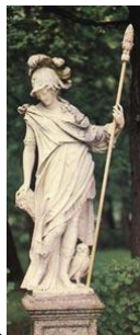
слайд № 10