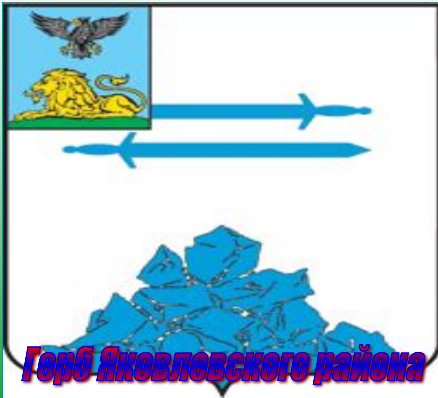
Герб Яковлевского района