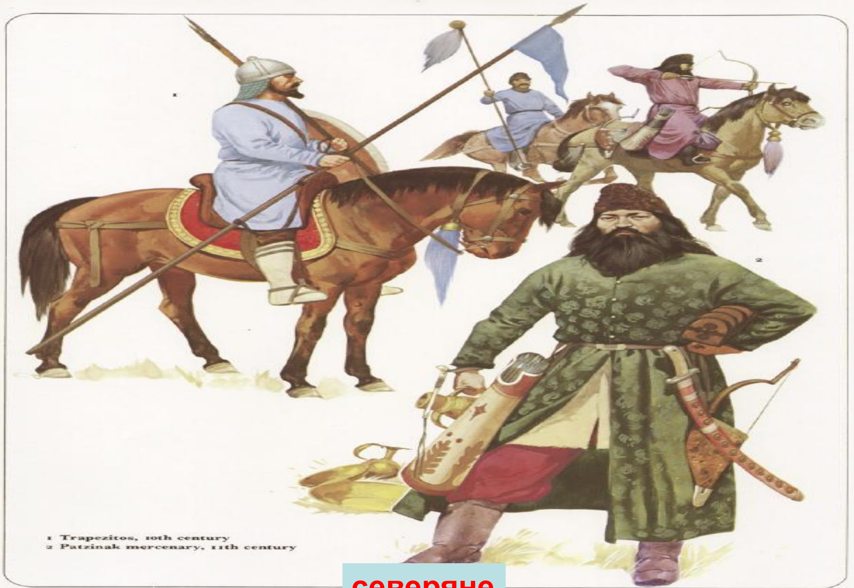
1 Trapezitos, 10th century 2 Patzinak mercenary, 11th century