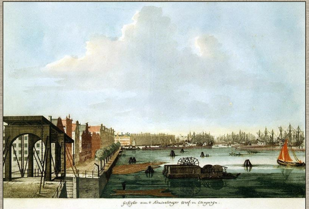
Geficht naar de Admiraleijer Werf en Magazyn.

Первый корабль с Адмиралтейской верфи был спущен на воду 29 апреля 1706 года.