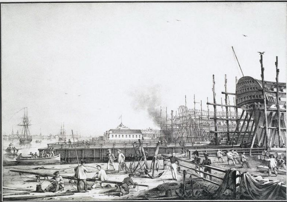
АДМИРАЛТЕЙСКОЙ ВЕРФТЬ. Chantier de l'Amirauté.

Строительство кораблей продолжалось до 1844 года.