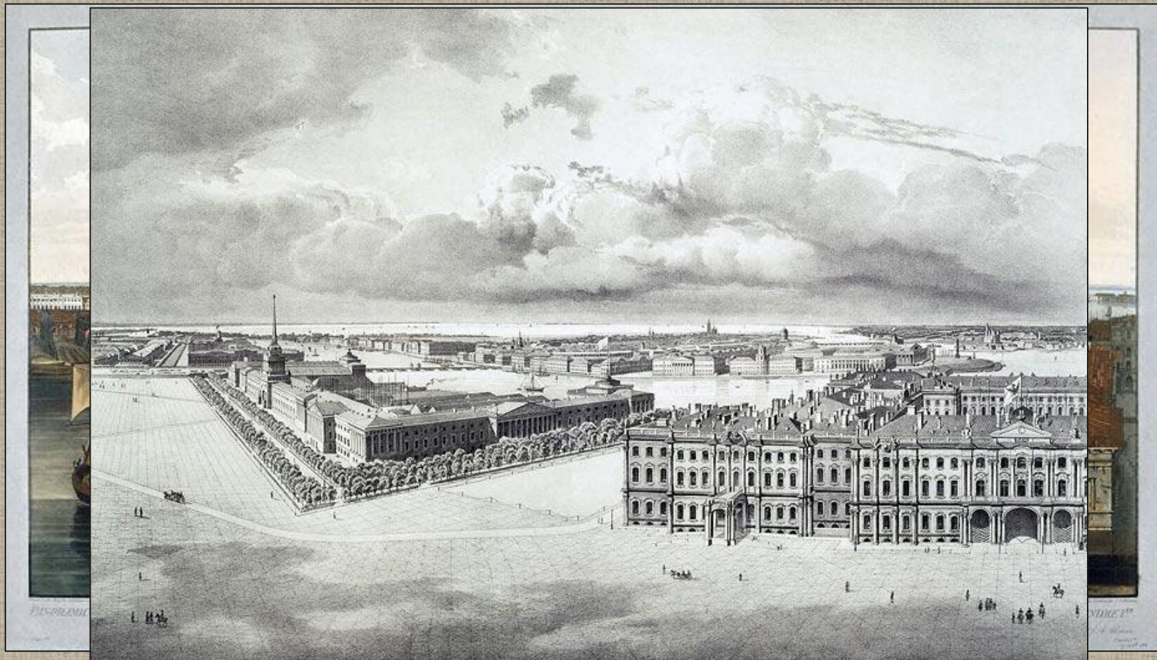
Чернецов Г.Г. Часть панорамы Адмиралтейства, бастион Кунетский и Александровской колонны

Адмиралтейство выполняло и оборонительную функцию: это была крепость, огражденная земляным валом с 5-ью земляными бастионами и глубоким рвом.