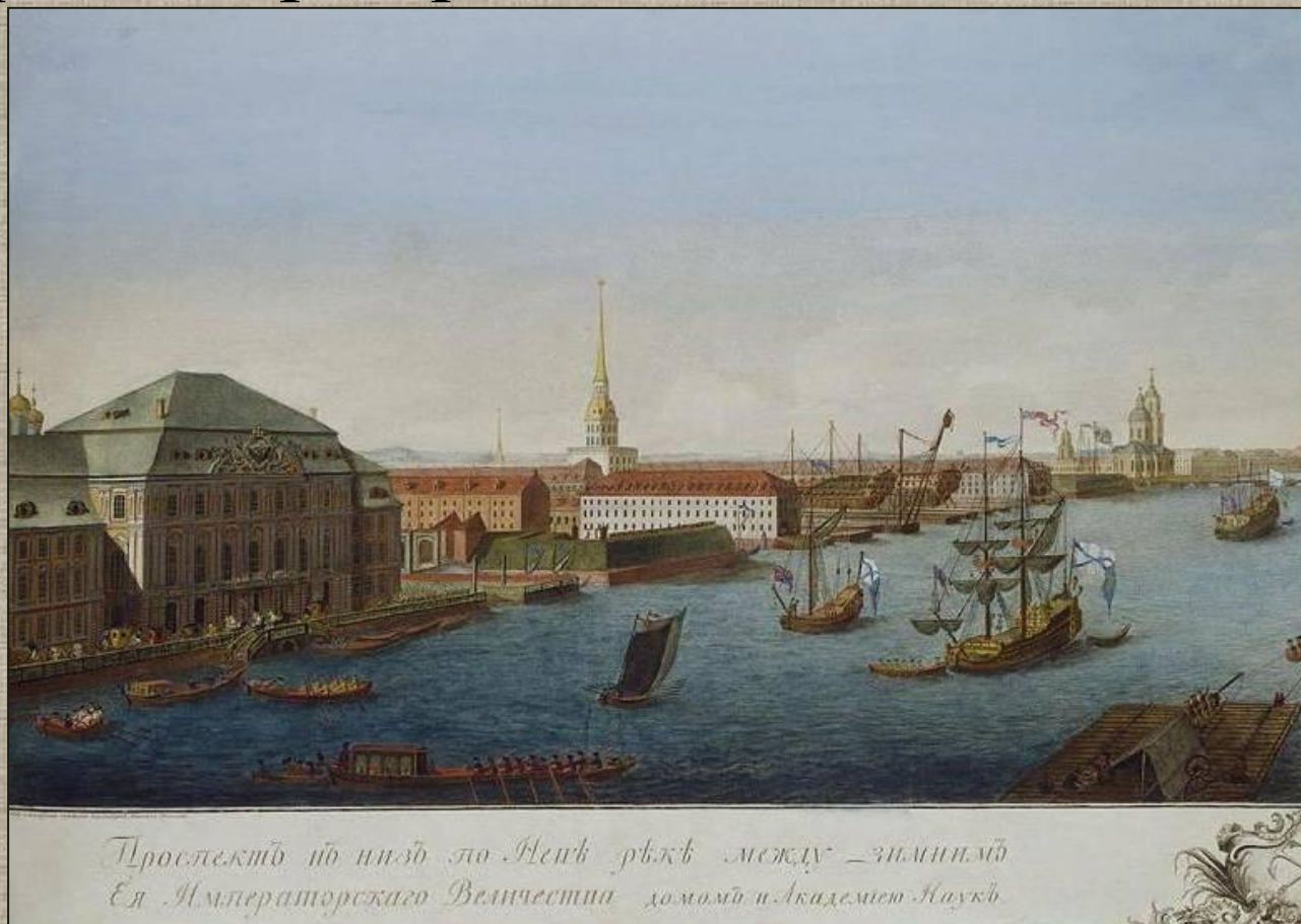
Виноградов Е. Г. Качалов Г. А. Вид вниз по Неве между Зимним дворцом и Академией наук.

Здание Адмиралтейства и территория вокруг него неоднократно перестраивались.