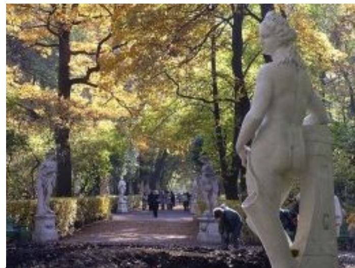
Летний сад в Петербурге