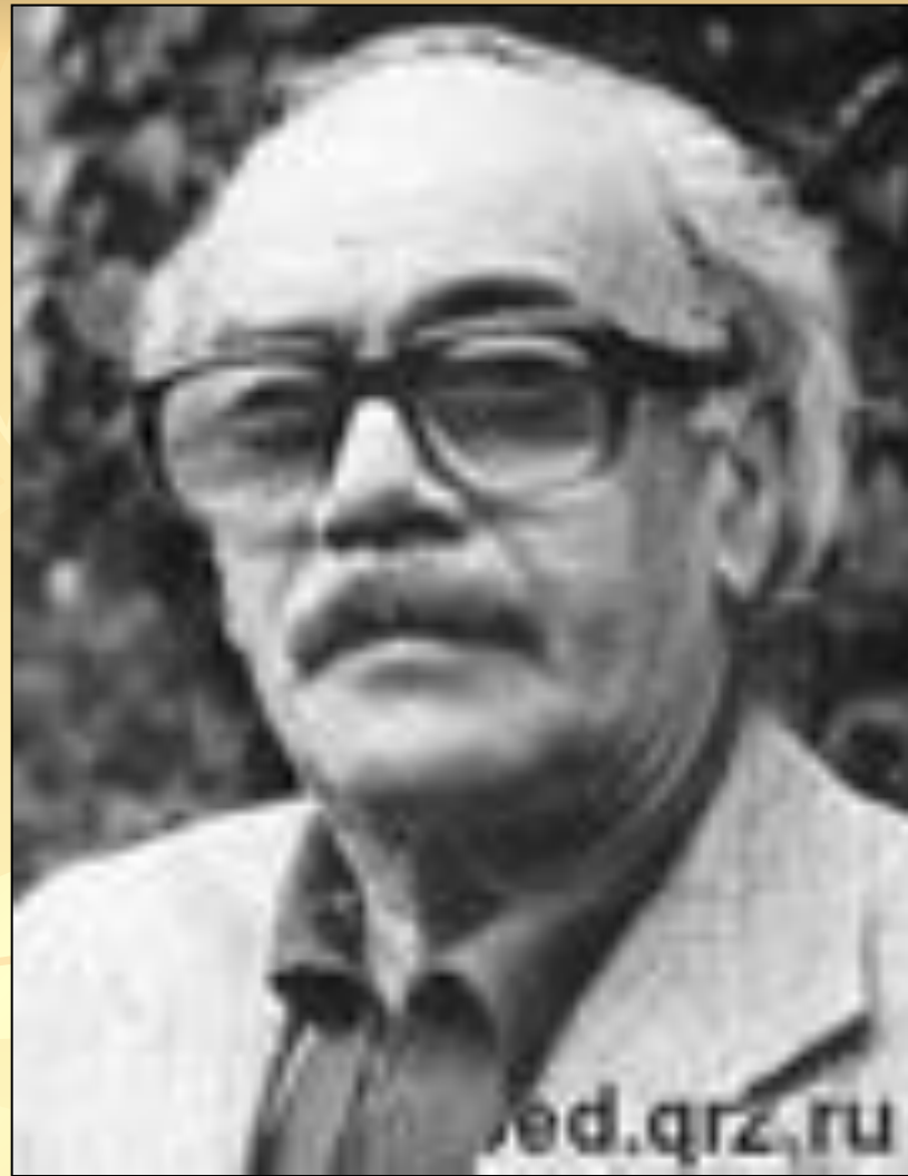
Давид Самуилович Самойлов (1920 – 1990)