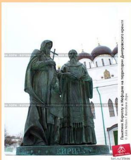
Памятник Кириллу и Мефодию на территории Днепропетровского кремля