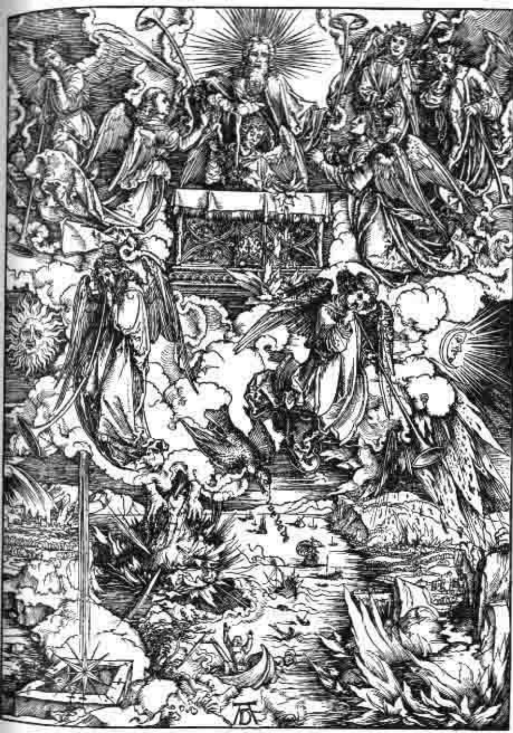
Семь ангелов с трубами