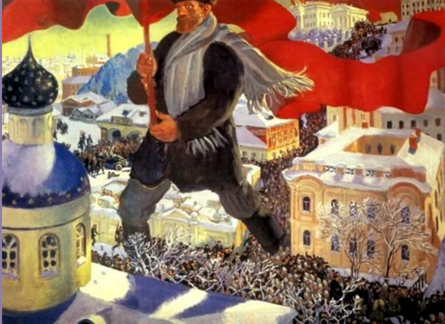
«Большевик» Б. Кустодиева