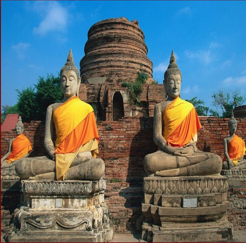
Образы бога Будды