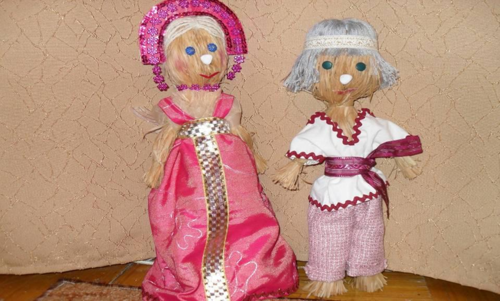
Хворајка и Неболейка