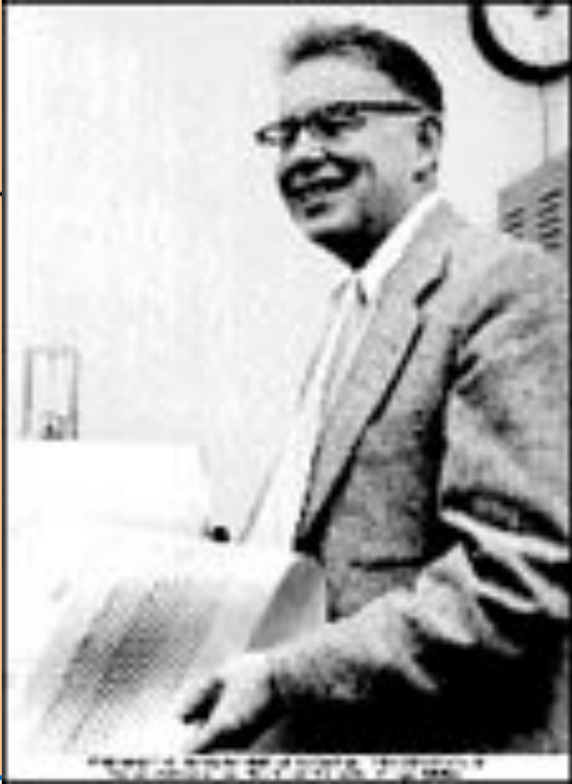
Автор специальной шкалы оценки магнитуд при землетрясении