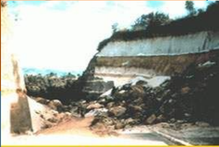
Обвал в горах