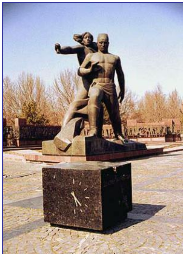
Памятник жертвам землетрясения