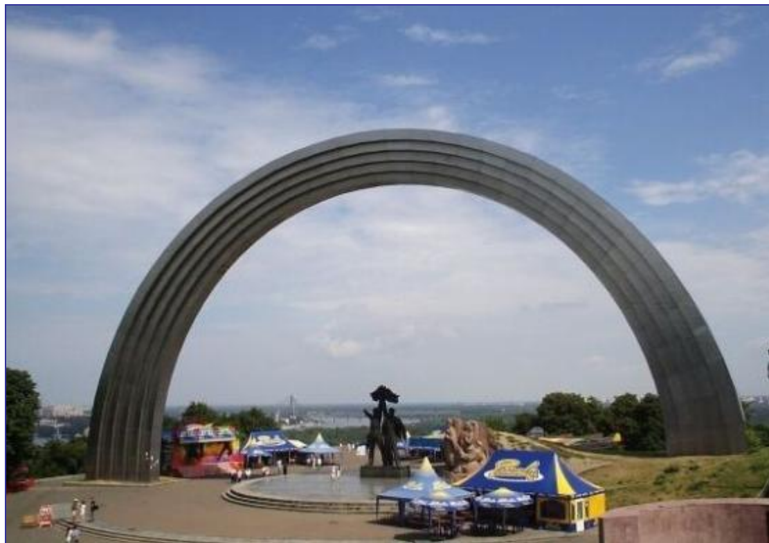
Арка дружбы в Киеве