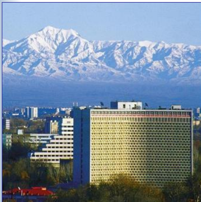
Ташкент – город мира и дружбы