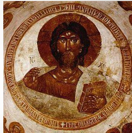
Спаситель. Роспись купола церкви Спаса Преображения на Ильине улице в Новгороде