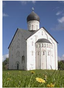
Церковь Спаса Преображения на Ильине улице в Новгороде