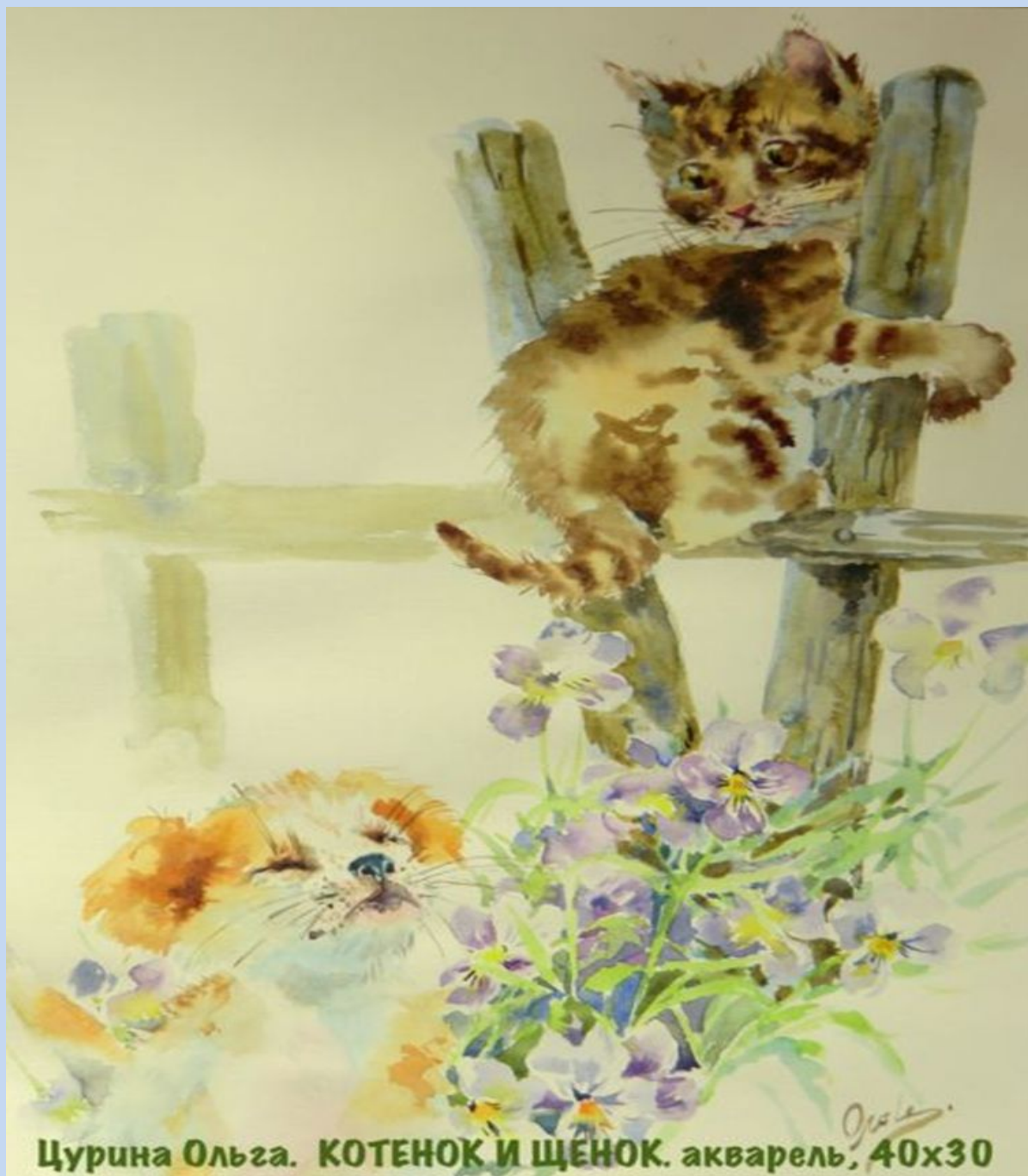
Цурина Ольга. КОТЕНОК И ЩЕНОК. акварель, 40x30