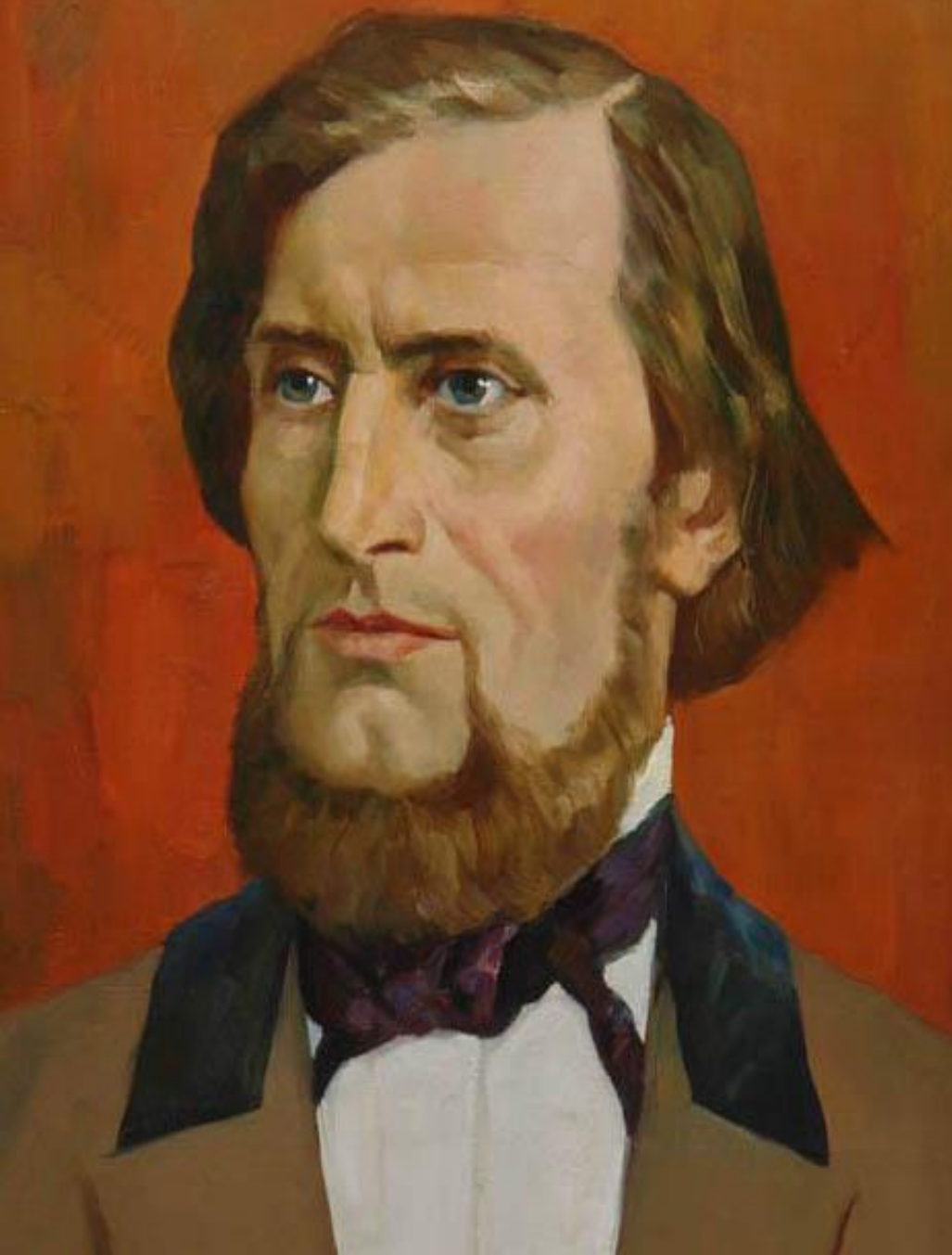
Константин Дмитриевич Ушинский