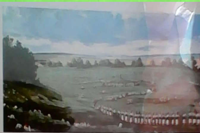
Юрши дэуш-ан о мордовским обряд