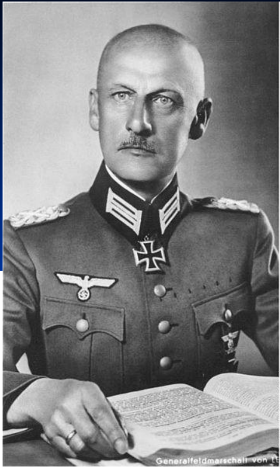
Generalfeldmarschall von Leeb

«Север» (генерал-фельдмаршал Вильгельм Риттер фон Лееб) была развёрнута в Восточной Пруссии, на фронте от Мемеля Группа армий «Север» (генерал-фельдмаршал Вильгельм Риттер фон Лееб) была развёрнута в Восточной