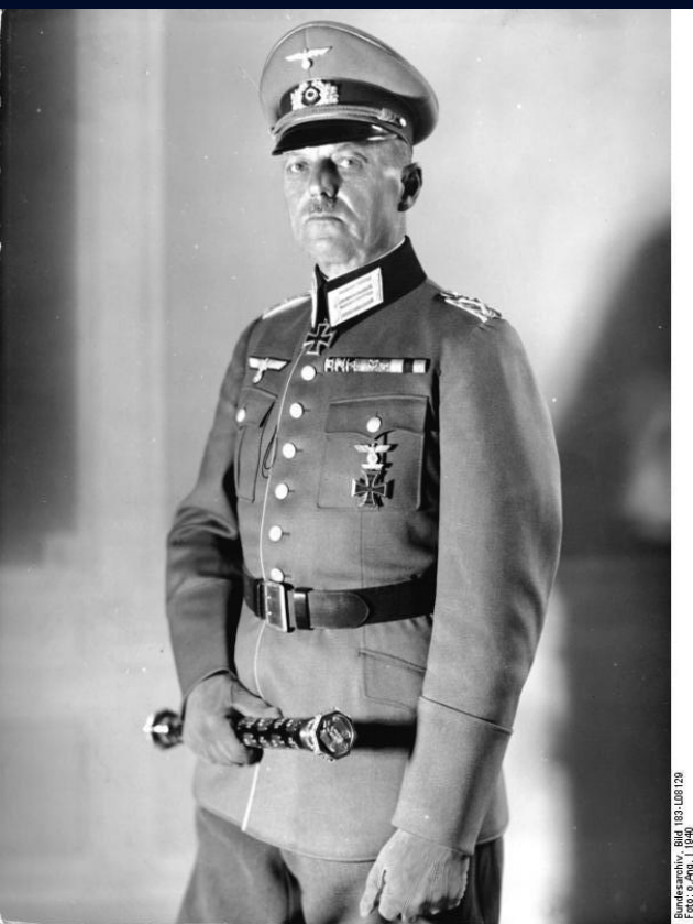
Bundesarchiv, Bild 103-L08120 Foto: a. Jng. | 1940

фельдмаршал Герт фон Гундсхед) занимала фронт от Люблина до устья Дуная. В неё входили 6-я армия, 11-я армия, 17-я армия , 3-я румынская армия , 4-я румынская армия , 4-я румынская армия, 1-я танковая группа , 4-я румынская армия, 1-я танковая группа и подвижный венгерский корпус , 4-я румынская армия, 1-я танковая