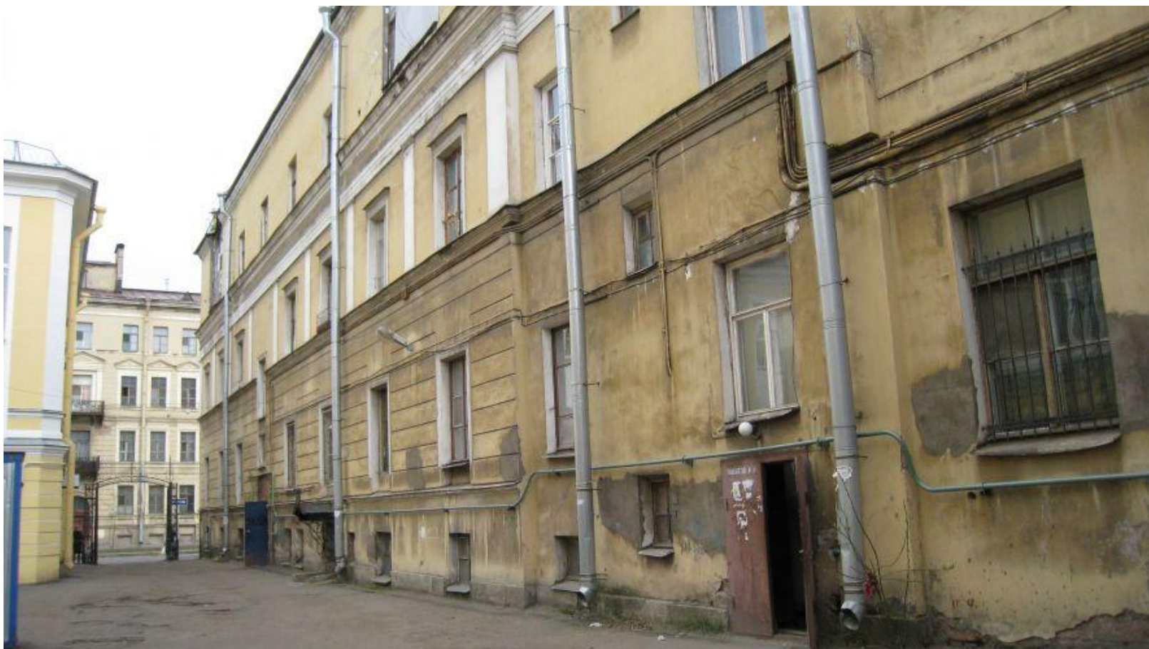
Дом при академии художеств. Подъезд, в котором предположительно находилась квартира Бруни. Современный вид