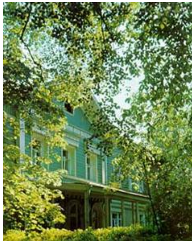
Дом П. И. Чайковского в Клину