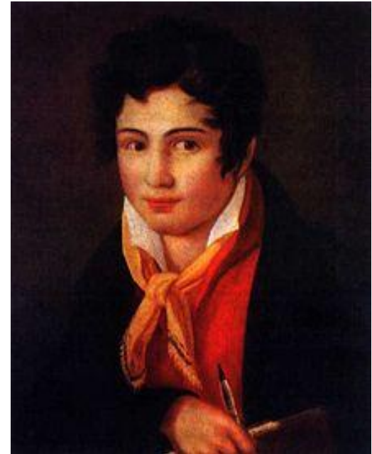
Ф. Бруни. Автопортрет, 1810-е