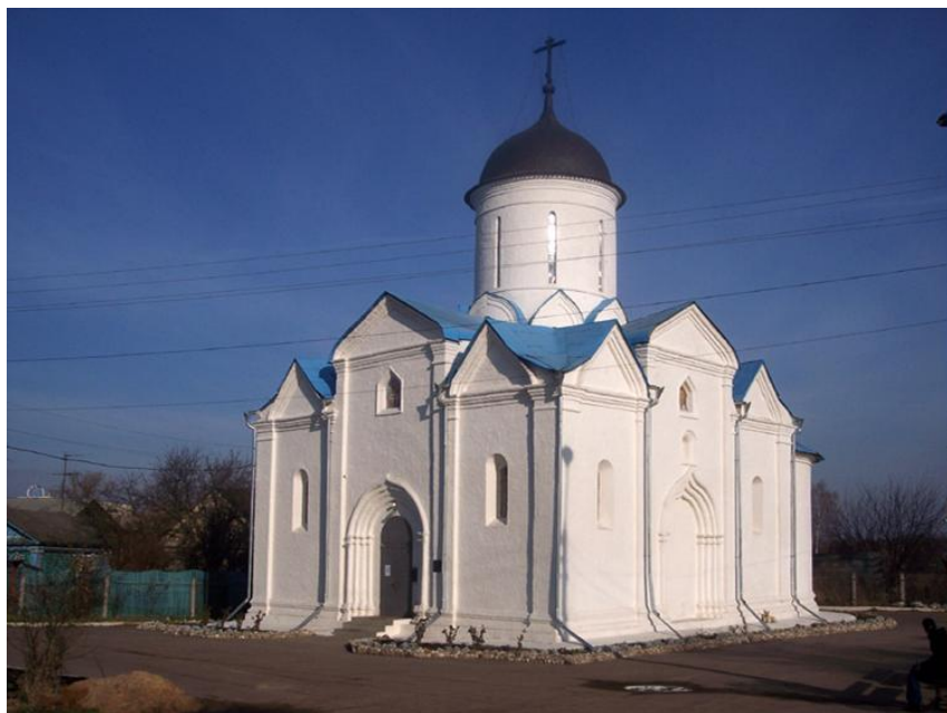
Успенская церковь в г. Клин. Современный вид