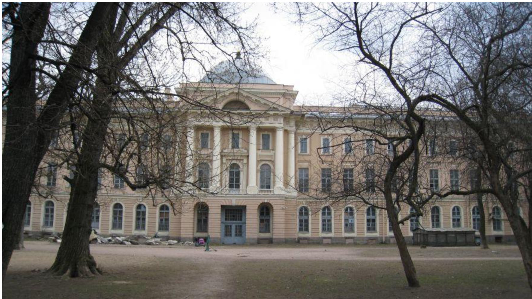
Дом Бруни при Академии художеств. Современный вид