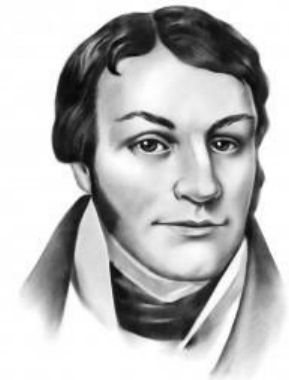
Григорій Квітка-Основ'яненко (1778—1843)