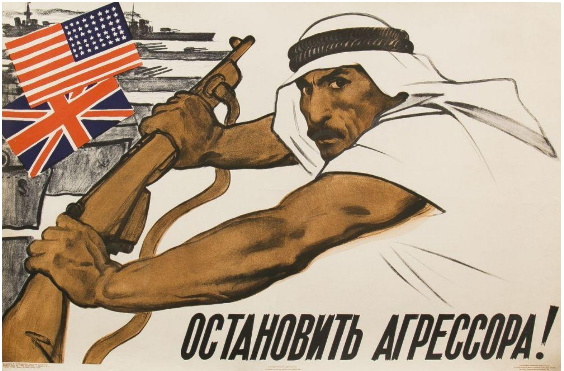
«Остановить агрессора!» Советский плакат 1956 г