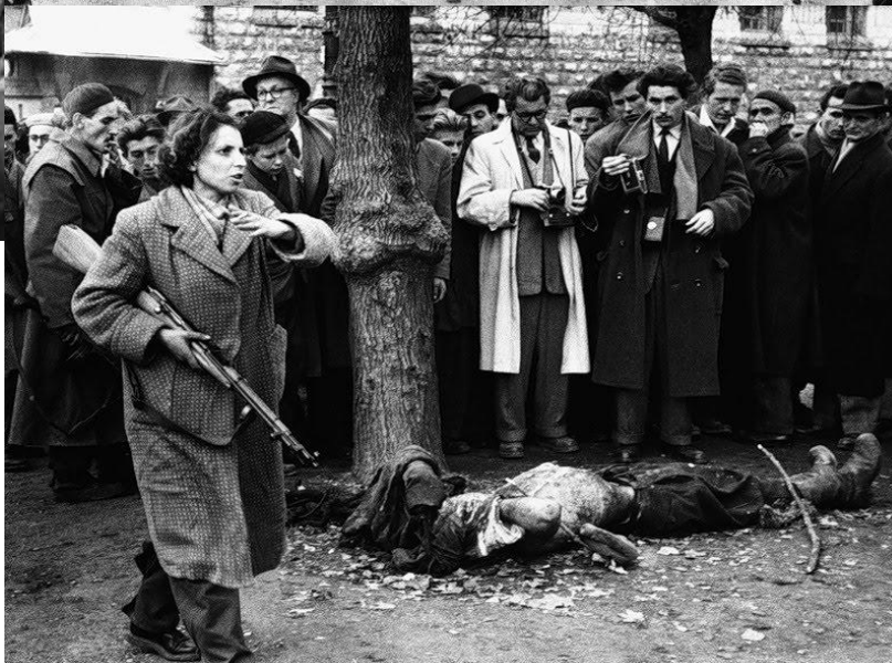
Расправы с сотрудниками госбезопасности на улицах Будапешта