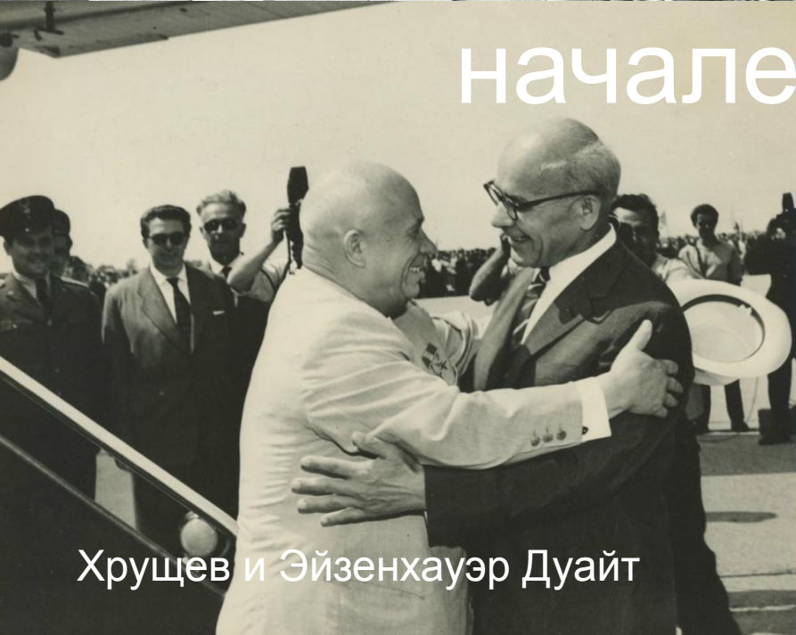
Хрущев и Эйзенхауэр Дуайт