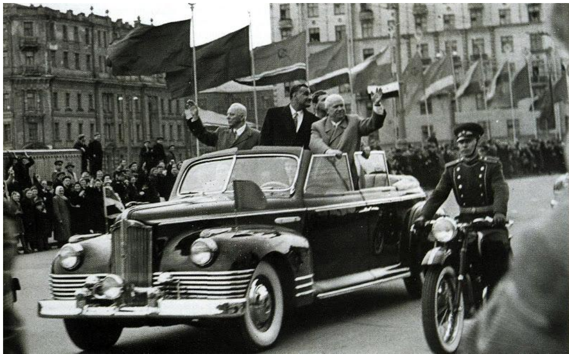
Г.А. Насер и Н.С. Хрущев в Москве в 1958 г .