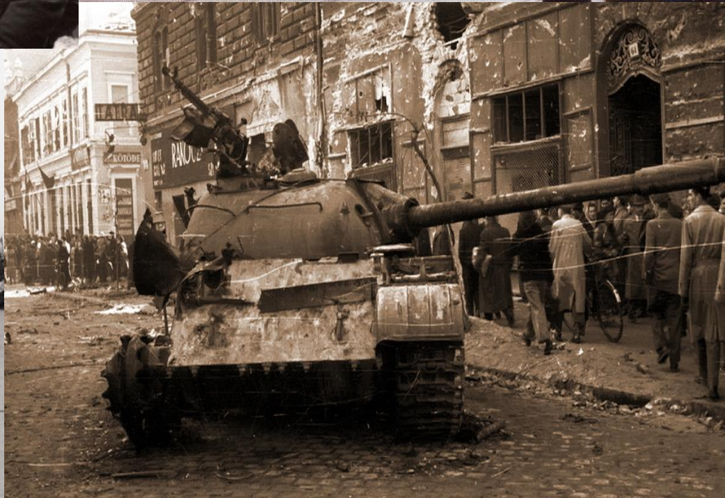
Венгерские повстанцы на улицах Будапешта