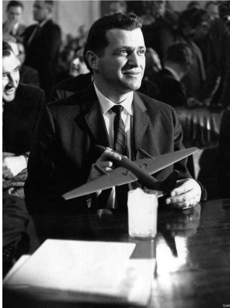
Фрэнсис Гэри Пауэрс

Срыв Парижской конференции привел к новому витку гонки вооружений. В 1961 г. СССР возобновил ядерные взрывы в атмосфере.