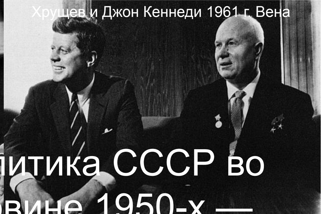
Хрущев и Джон Кеннеди 1961 г. Вена