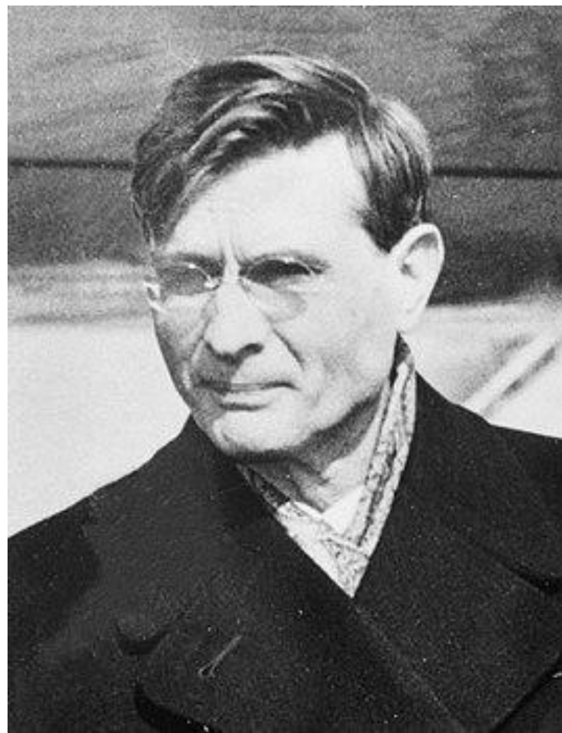
Михаил Андреевич Суслов