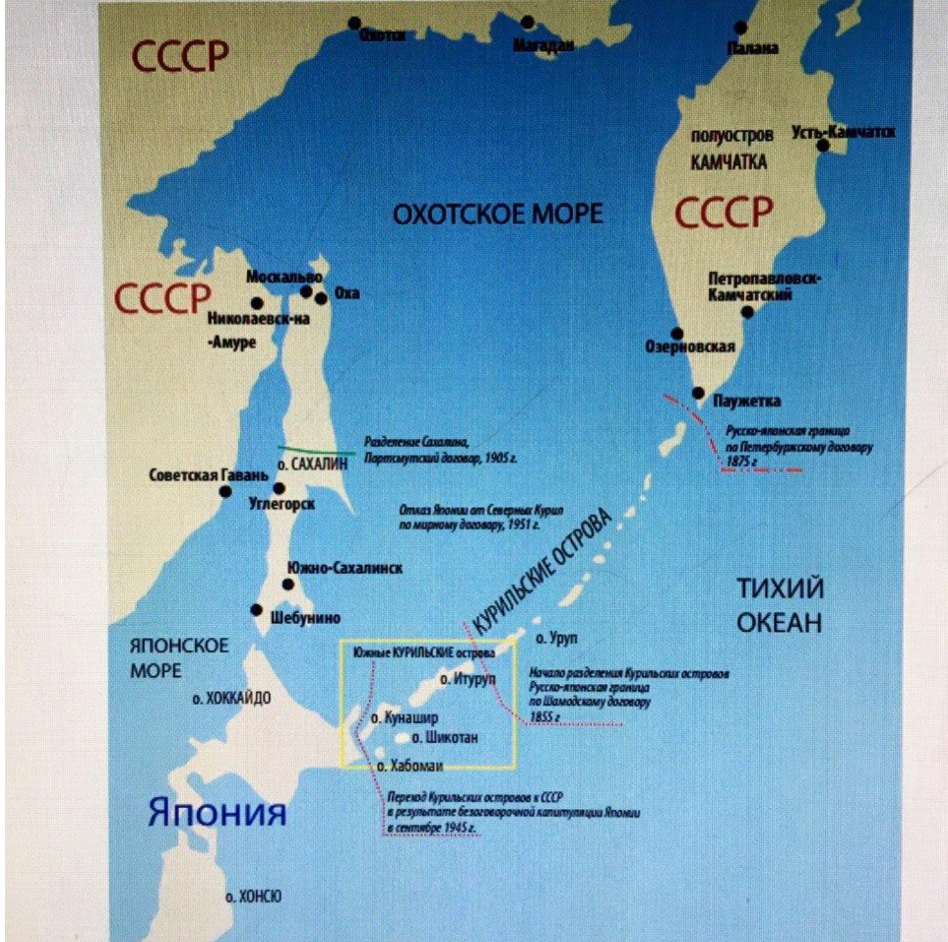
Охотское море с Курильскими островами. Карта