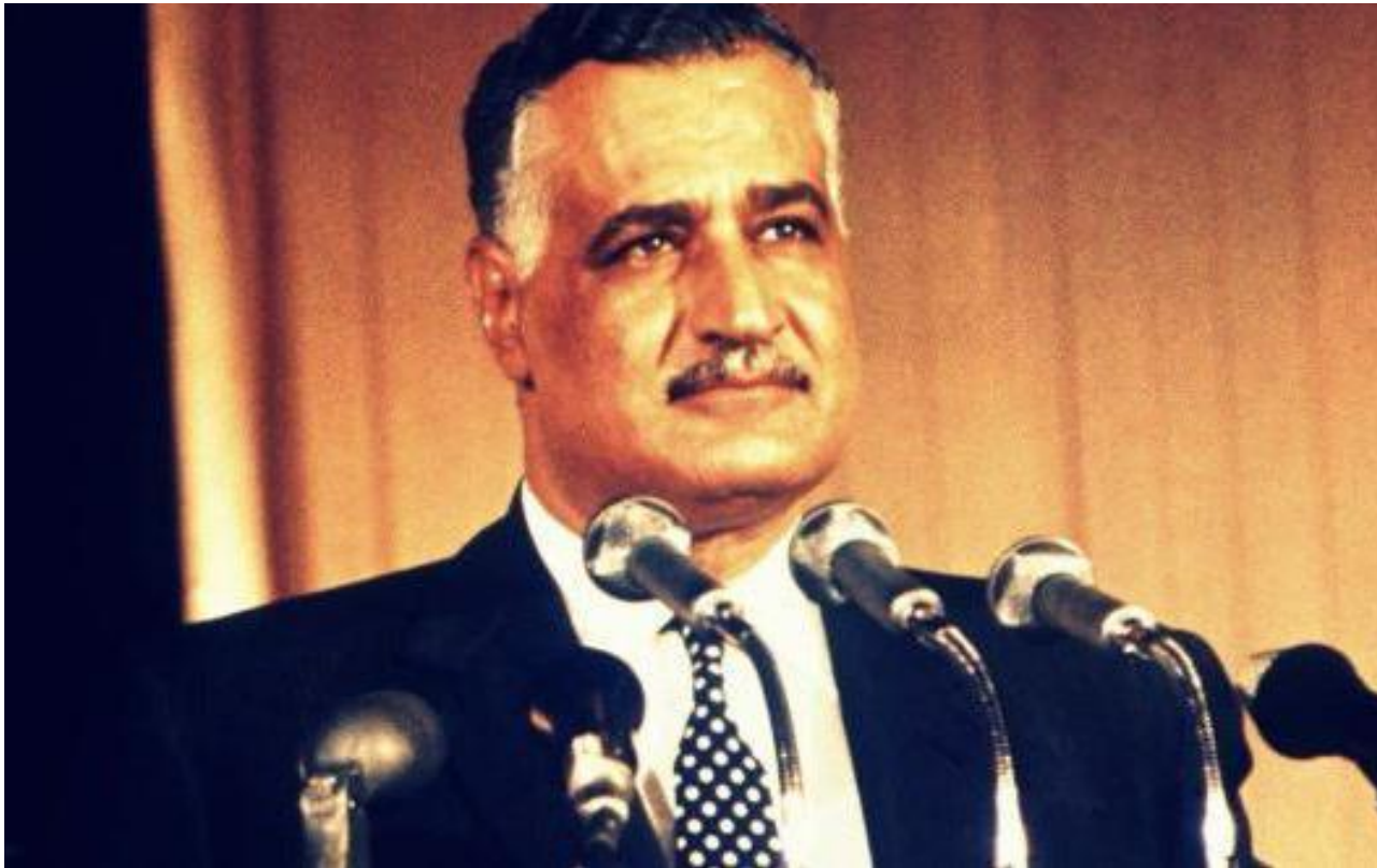
Гамаль Абдель Насер

В 1952 г. в Египте была свергнута монархия. К власти пришла организация «Свободные офицеры» во главе с Г.А. Насером.