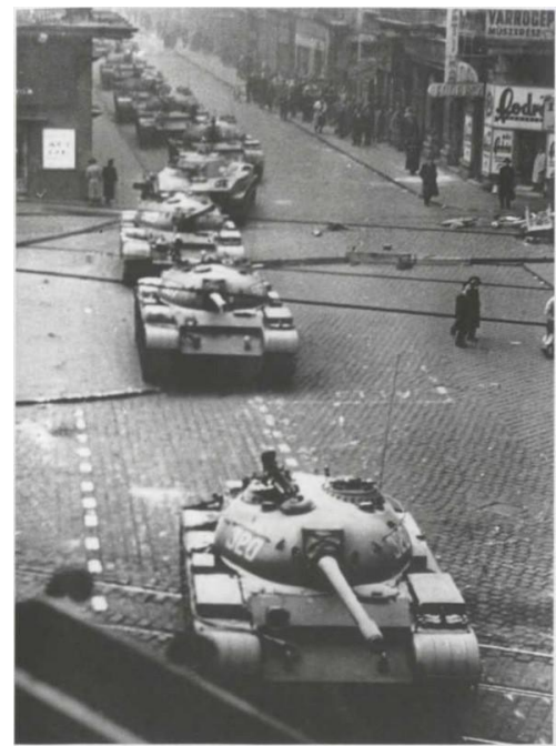
Советская бронетехника в Будапеште