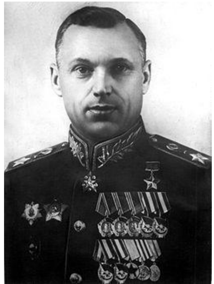
Константин Константинович Рокоссовский

Единственный в истории СССР маршал двух стран: Маршал Советского Союза (1944) и маршал Польши (1949) .