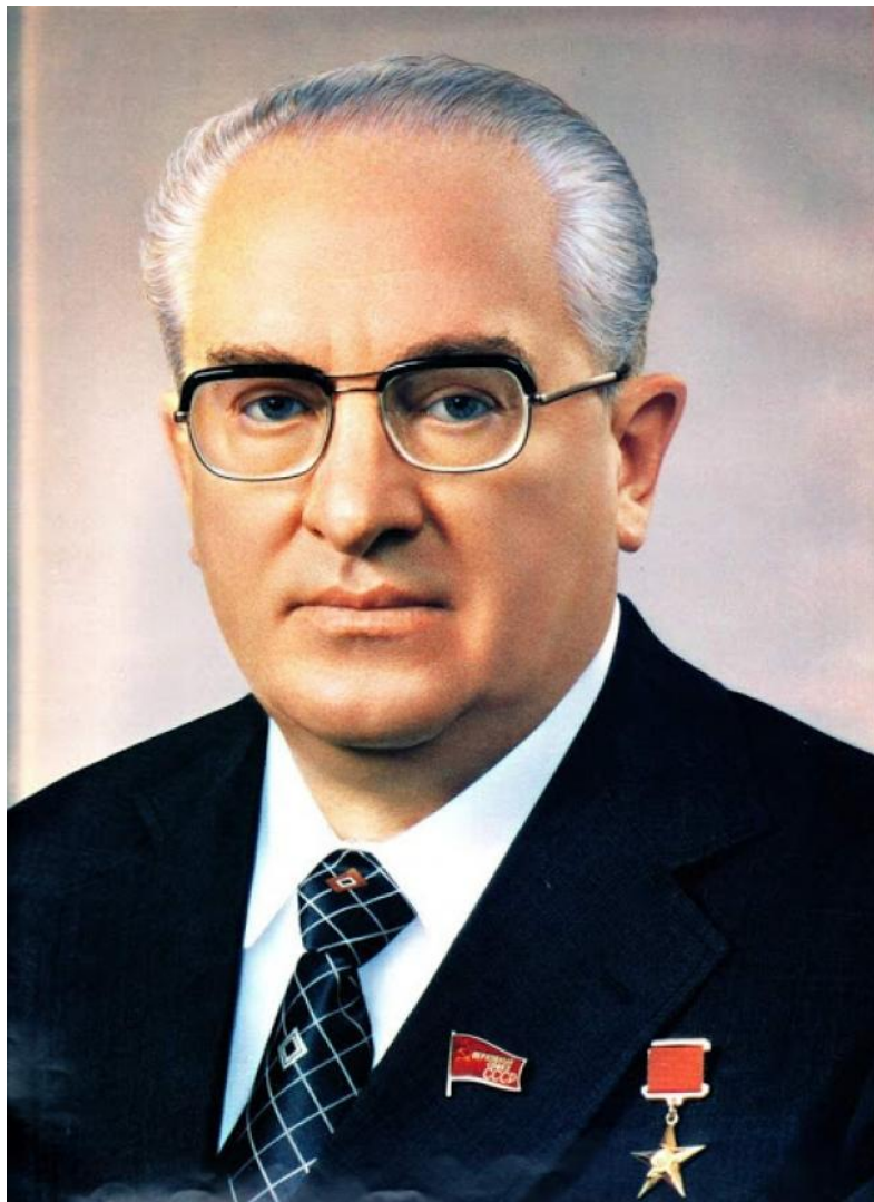
Юрий Владимирович Андропов