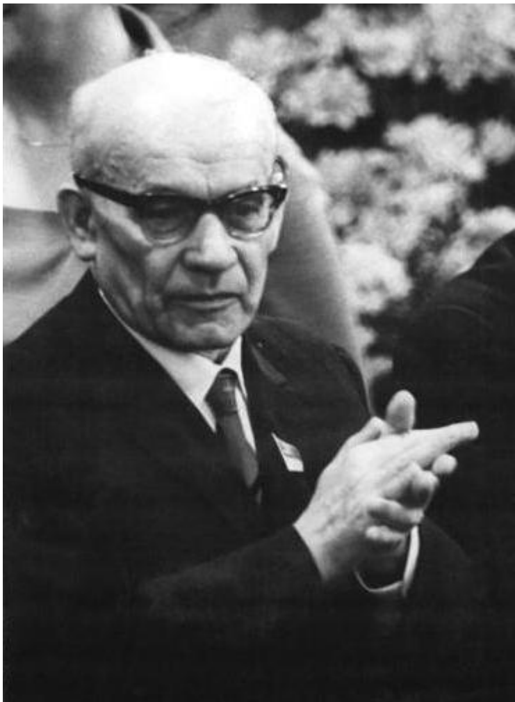
Владислав Гомулка первый секретарь ЦК Польской объединённой рабочей партии (ПОРП) в 1956—1970.