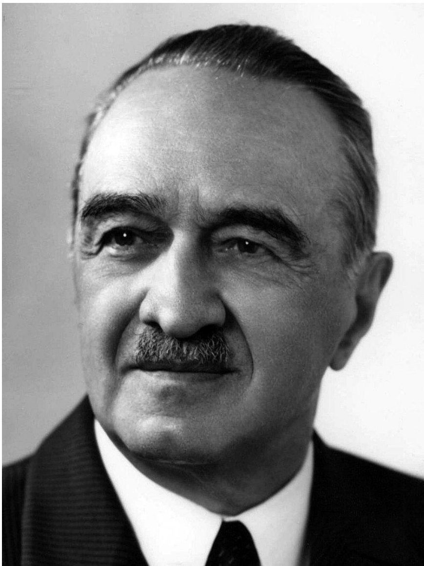
Анастас Иванович Микоян