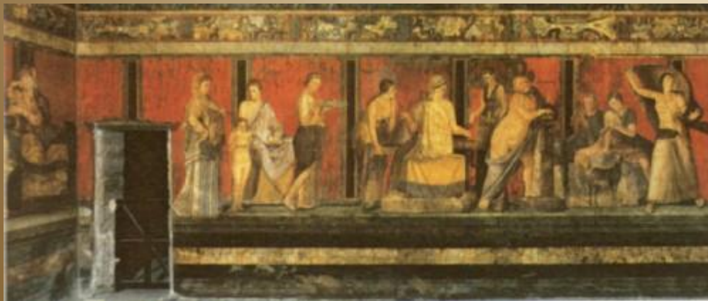
Фреска с виллы Мистерий близ Помпеи

Римская живопись, отталкиваясь непосредственно от греческих образцов, использовала различные возможности для пластического изображения: цветовая и воздушная перспектива, свет и тени создавали иллюзию пространства. Художники часто изображали сцены из повседневной жизни и натюрморты. О живописи эпохи Римской империи мы можем судить прежде всего по фрескам, покрывавшим стены домов знати. Само по себе искусство декорирования восходит к греческой традиции расписывания стен и обустройства внутренних двориков скульптурами. Орнаментальная живопись интерьеров в течение I века до н. э. вытеснялась имитацией архитектурного декора и свелась в итоге к живописи и скульптуре «trompe l'œil», что отражало тяготение к пышности. Неплохо сохранились фрески нескольких вилл города Помпеи, засыпанных пеплом в результате извержения вулкана Везувия. Они показывают, что художники свободно владели всеми живописными средствами, (богатой палитрой, игрой света и тени, точным рисунком и т. п.). Станковая живопись не сохранилась, но из письменных источников известно, что ведущим жанром был портрет. Наряду с жилищем римляне расписывали -домашнюю мебель и посуду.