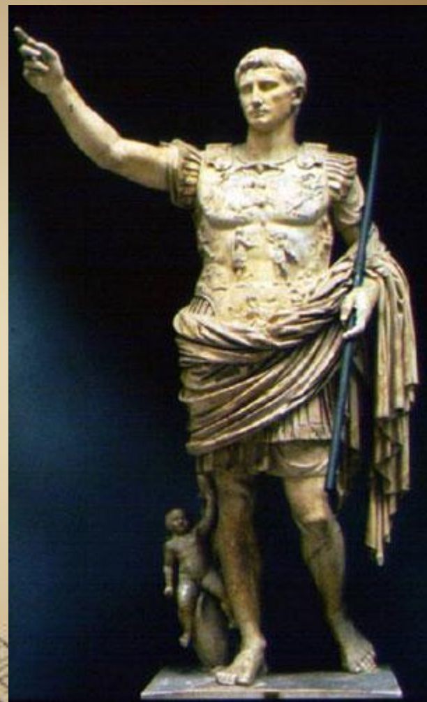
Август из Прима-Порта. I век Мрамор. Высота 2,04 м

Римское искусство скульптуры достигло удивительного реализма, если греки стремились изобразить идеал, то римляне — наиболее точно передать черты оригинала. Глаза многих статуй для достижения натуралистичности изготовлены из цветной эмали. Римский портрет — это история Рима, рассказанная в лицах реально существовавших людей. До нас дошел великолепный скульптурный портрет юного Августа, сохранились многочисленные бюсты политических деятелей.