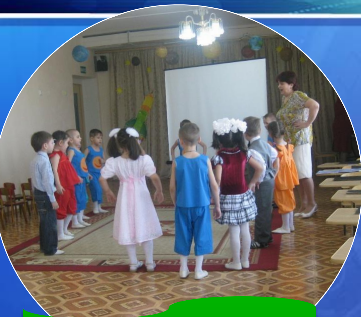
Динамическая зарядка: «Космодром»