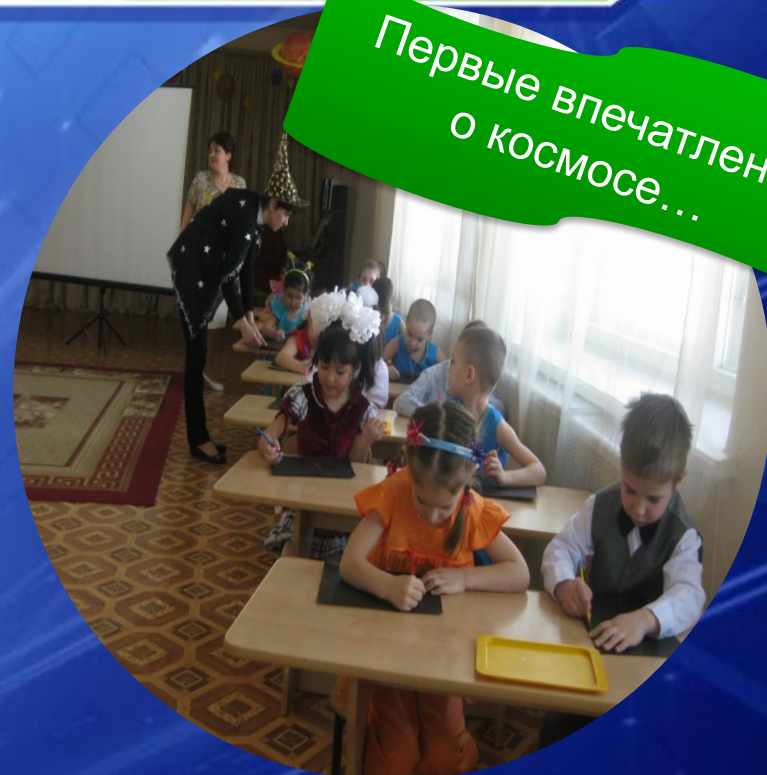
Первые впечатления о космосе...

Возвращаемся на Землю. Всё, что увидели запишем в бортовые журналы, чтобы потом поделиться своими впечатлениями о космическом путешествии. «Пишем» палочками на специально приготовленных листах, техника рисования – граттаж, что в переводе с французского означает «скрести».