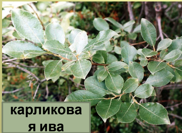
карликовая я ива