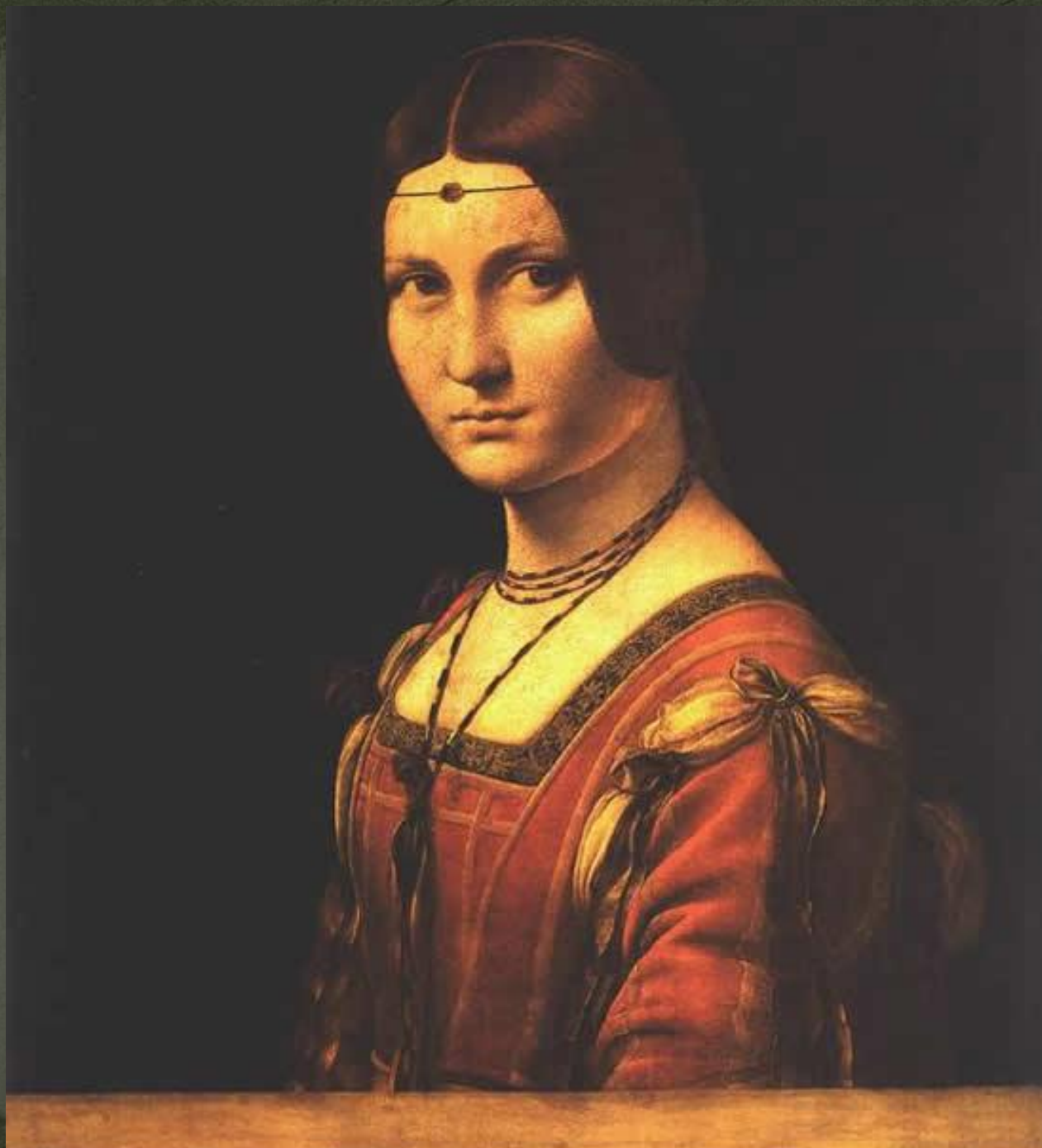
Портрет неизвестно й 1490-1496