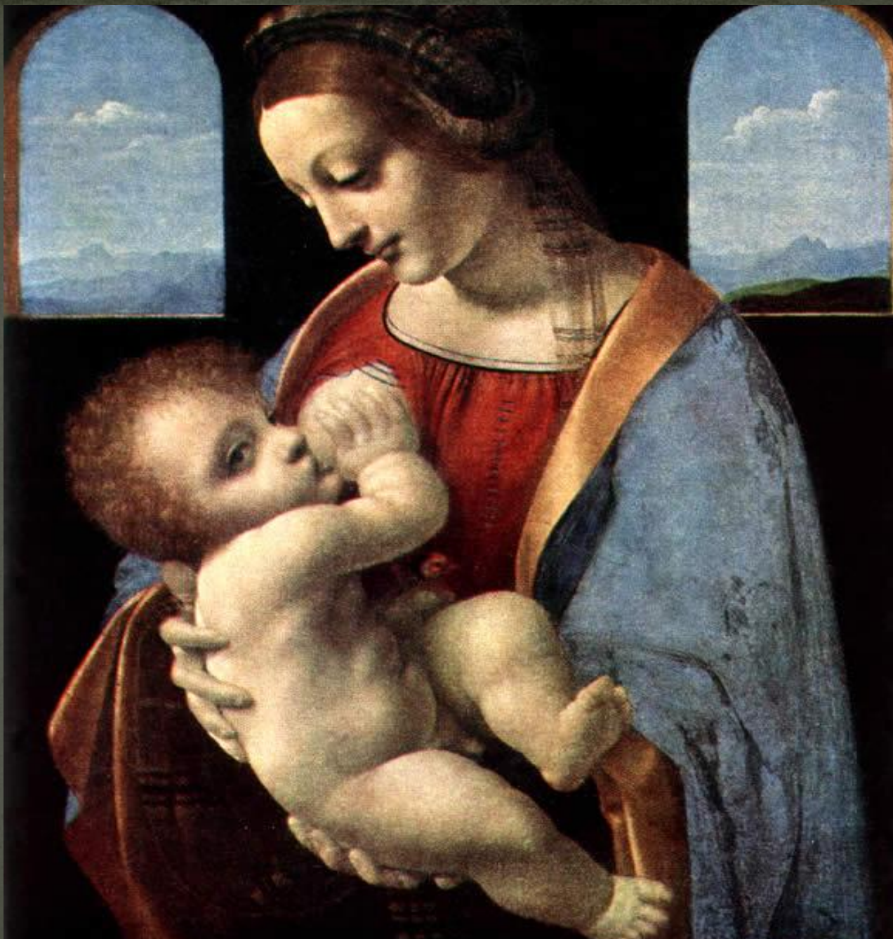
Мадонна Литта 1478- 1482