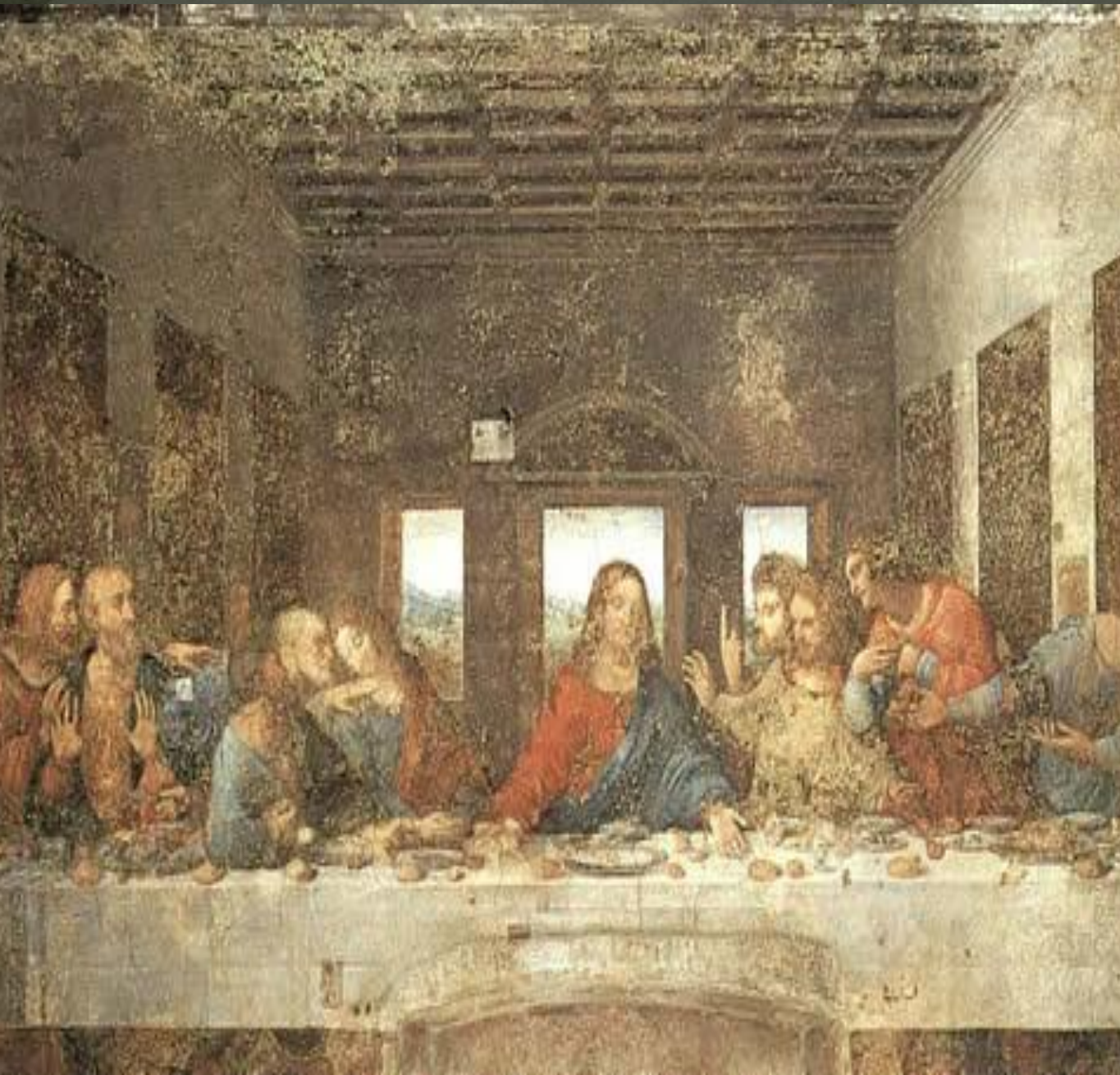
Тайная вечеря 1494-149 8