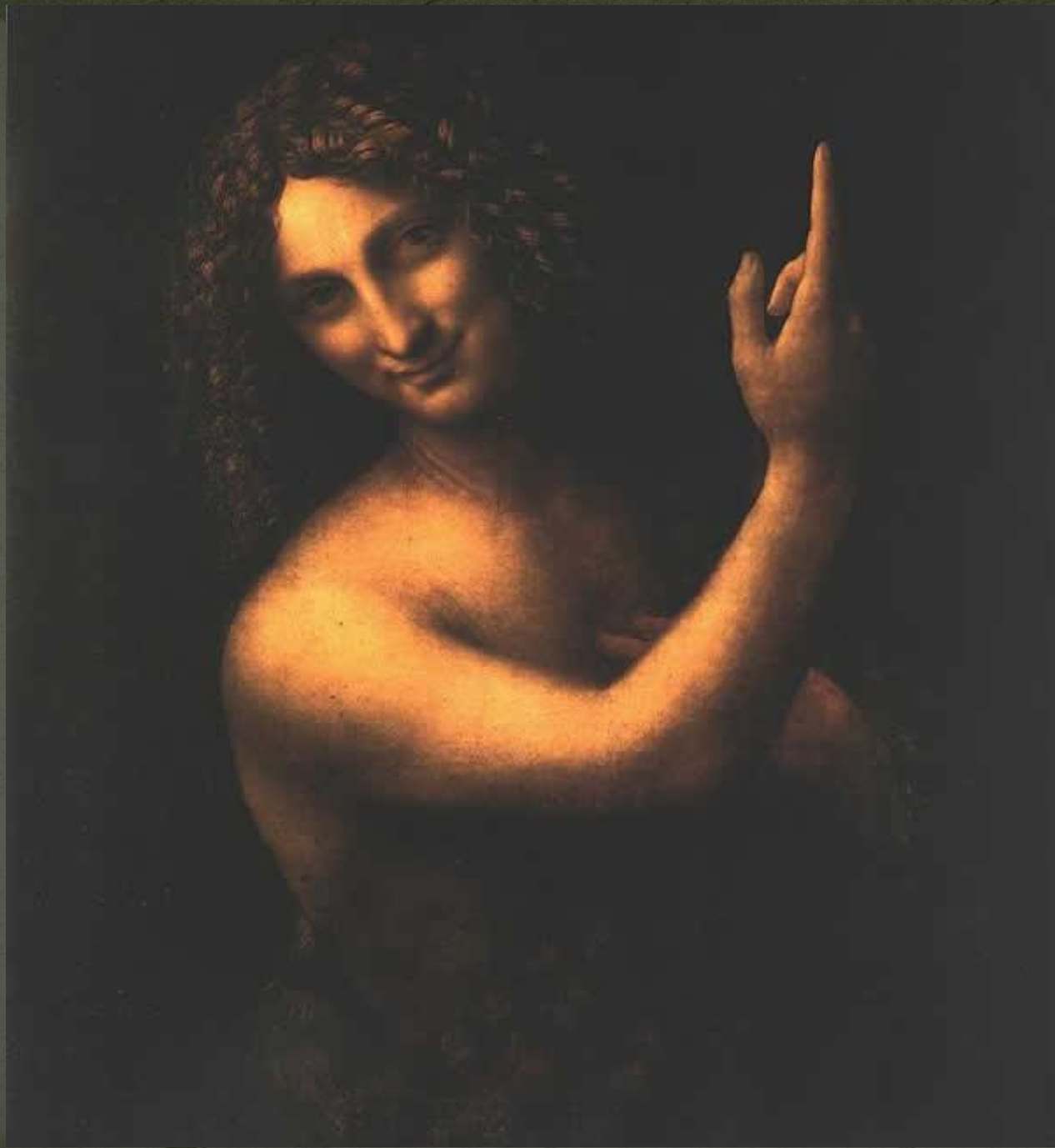
Иоанн Креститель 1512