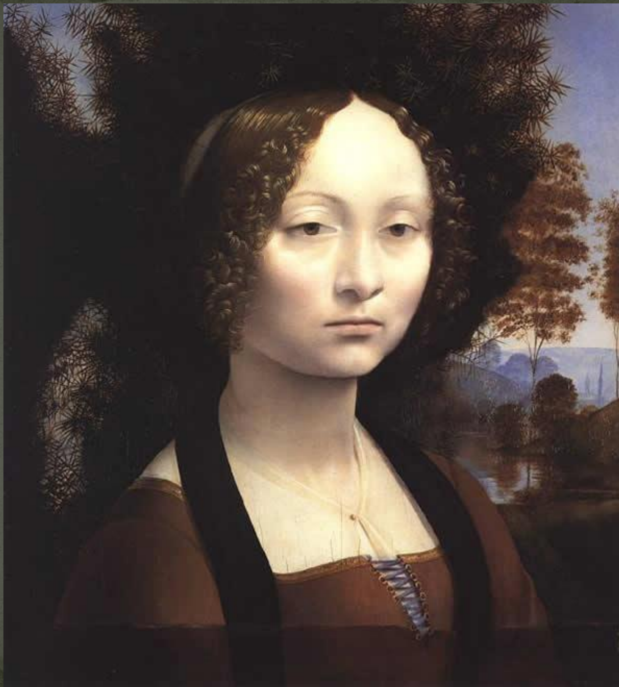
Портрет Жиневры де Бенчи 1475-1478