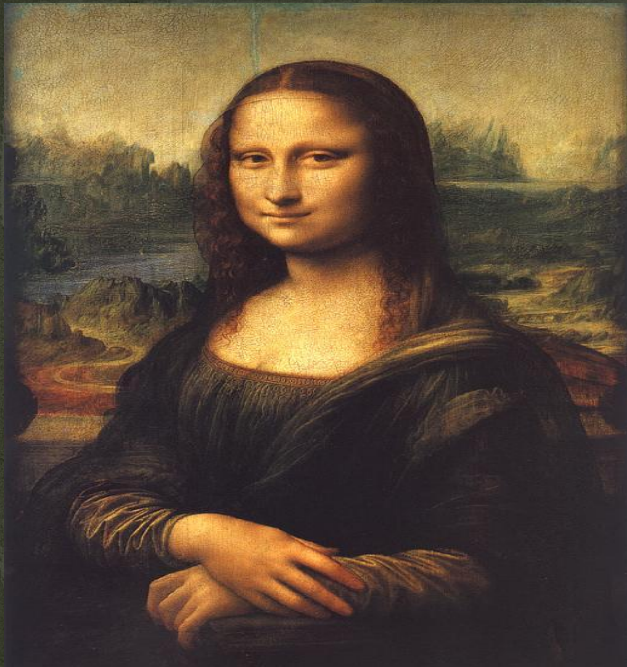
Мона Лиза (Джоконда) 1514-1515