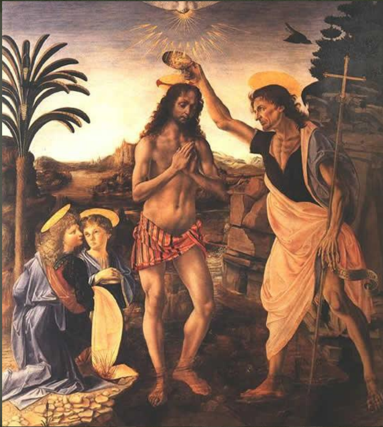
Крещение Христа 1473-1475