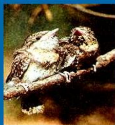
Вертишейка. Воронежский заповедник