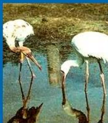
Стерхи . Окский заповедник