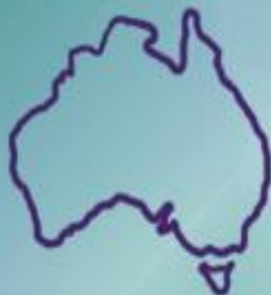
АВСТРАЛИЯ и ОКЕАНИЯ