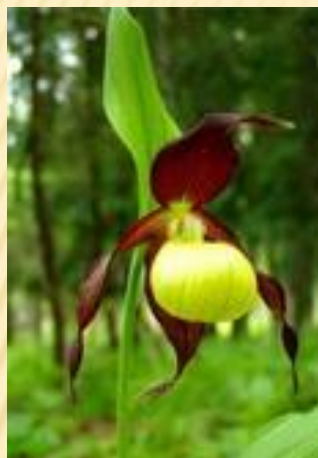
венерин башмачок настоящий

В заповеднике встречается 769 видов высших сосудистых растений