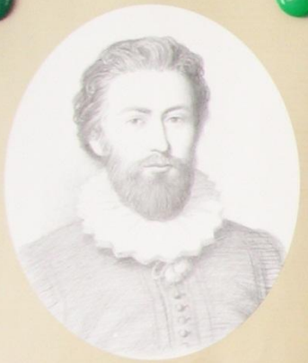
Франсуа ВИЕТ (1540–1603)