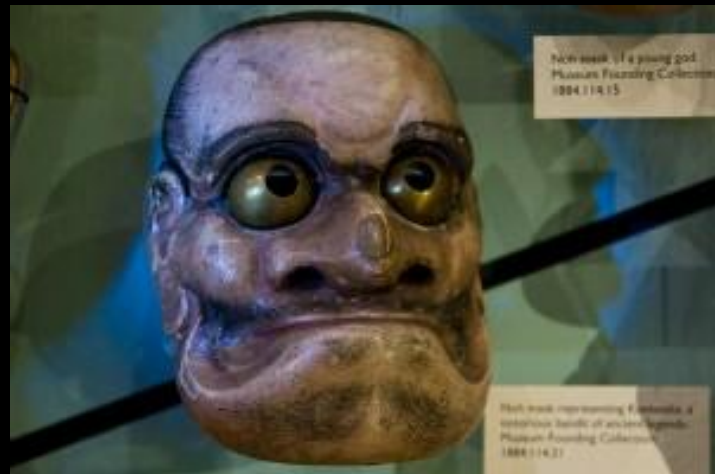
Ichimasa, 11 a young god Museum Founding Collection 1884.114.15