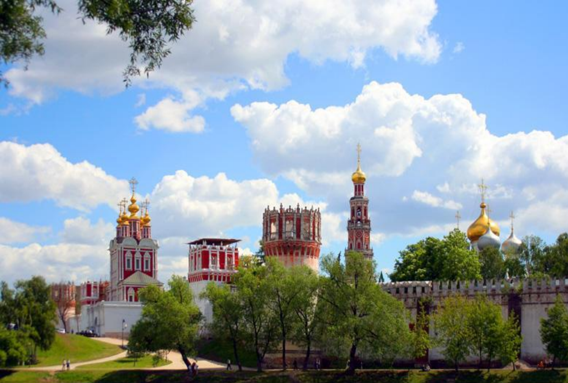
Чудров Д.А. МОУ СШ №3 с. К. Выбелов Хакайского р. на Приморского края