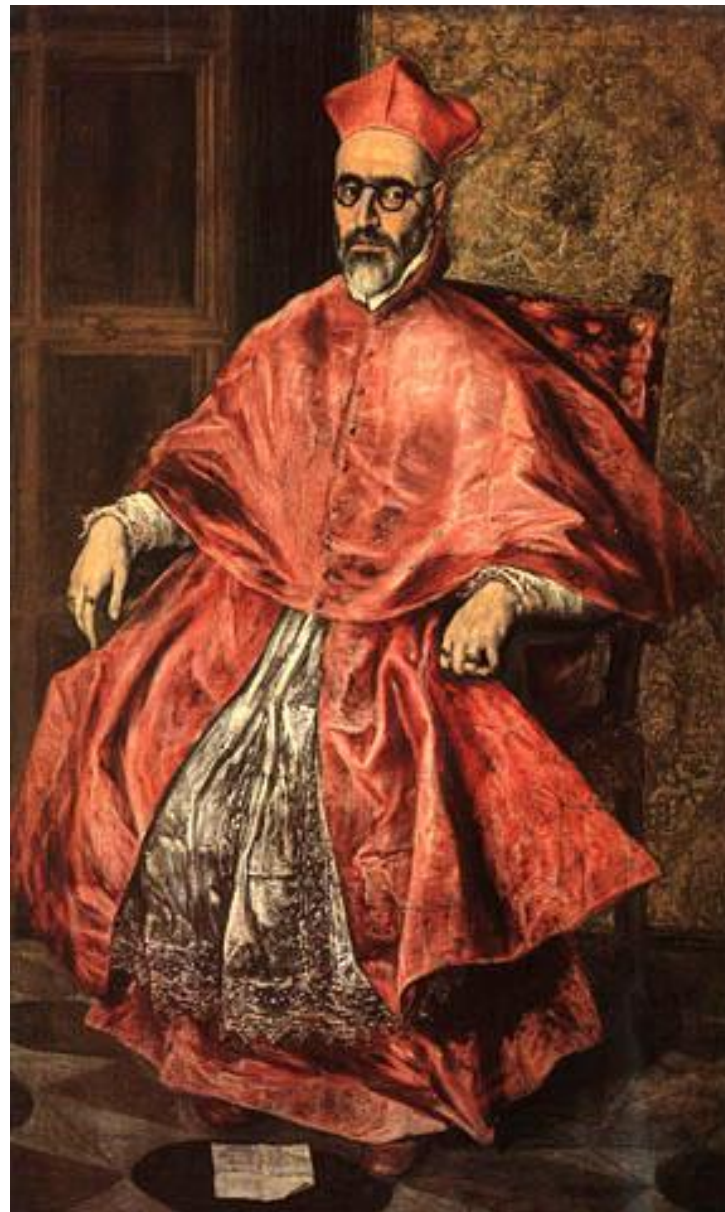
Св. Иероним в образе кардинала