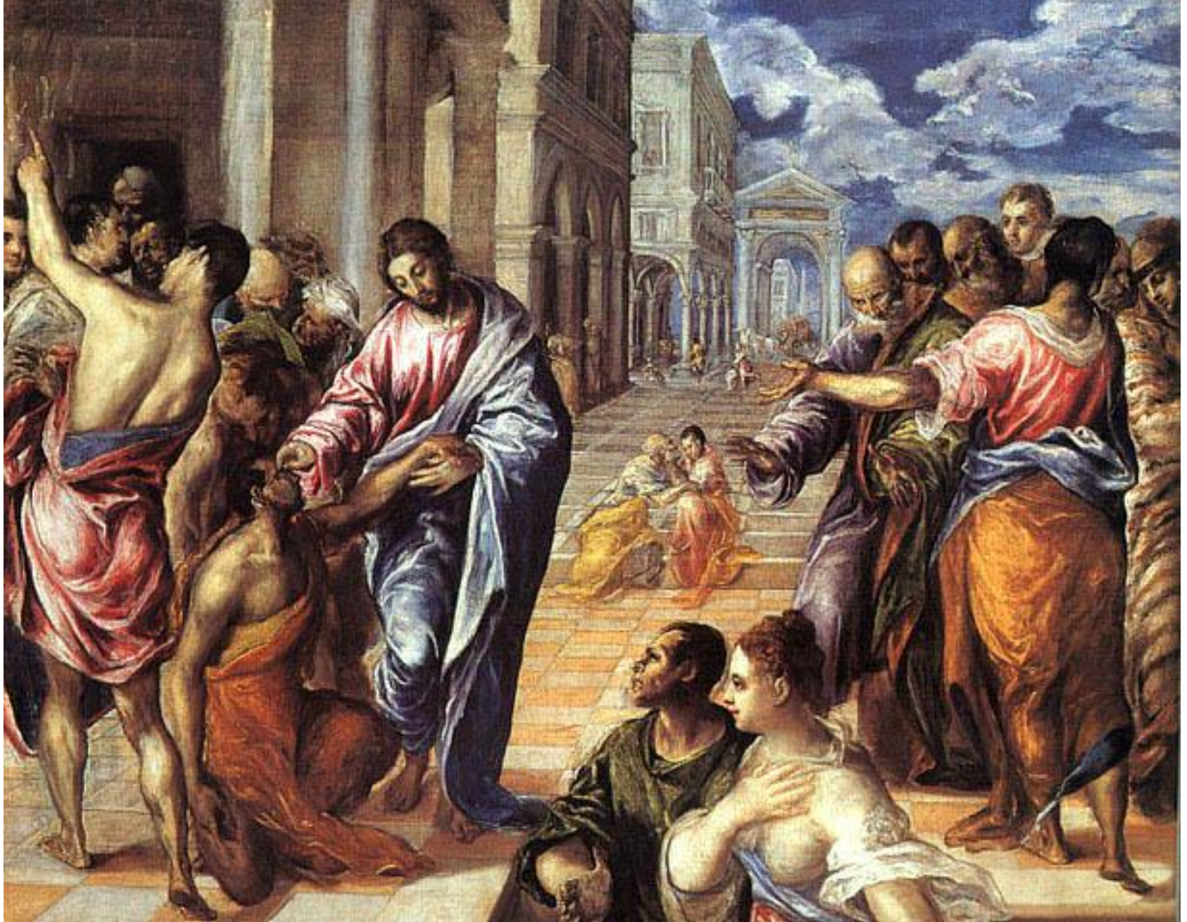
«Христос, исцеляющий слепого»