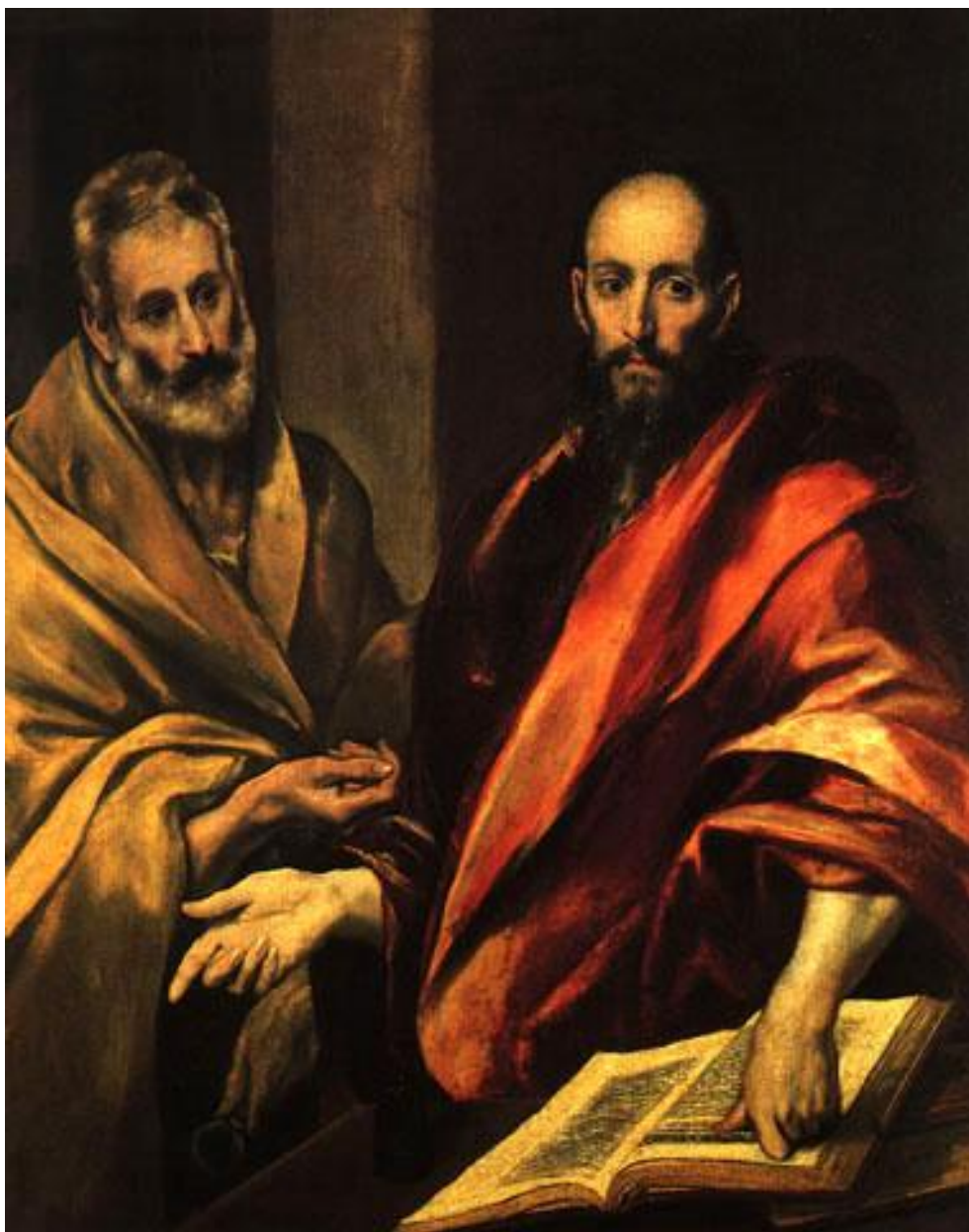
«Апостолы Пётр и Павел»