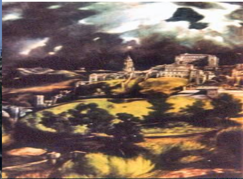
Толедо. Замок Алькасар