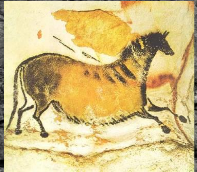
Лошадь. Пещера Ласко