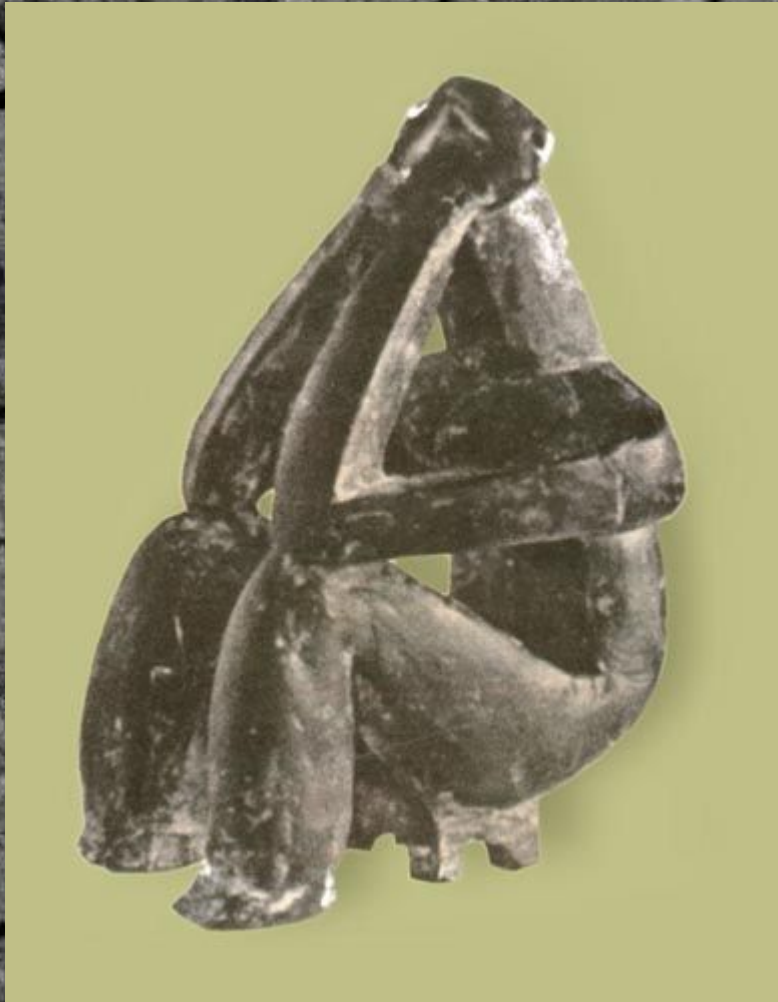
«Мыслитель» V-III тыс. до н.э.