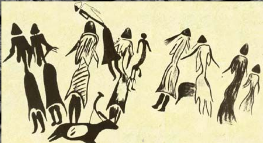
Танцующие женщины. XII-X тыс. до н.э. Пещера Когул, Испания

X-V тыс. до н.э. Ущелье Валторта, Испания