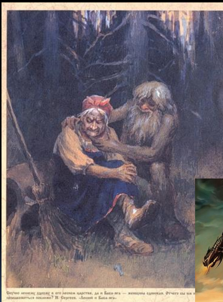
Случайно леснику Владимиру в его лесном царстве, да и Баба-яга — женщина-завидка. Отчего вы бы не познакомились поближе? И. Герасов. «Лесной и Баба-яга».