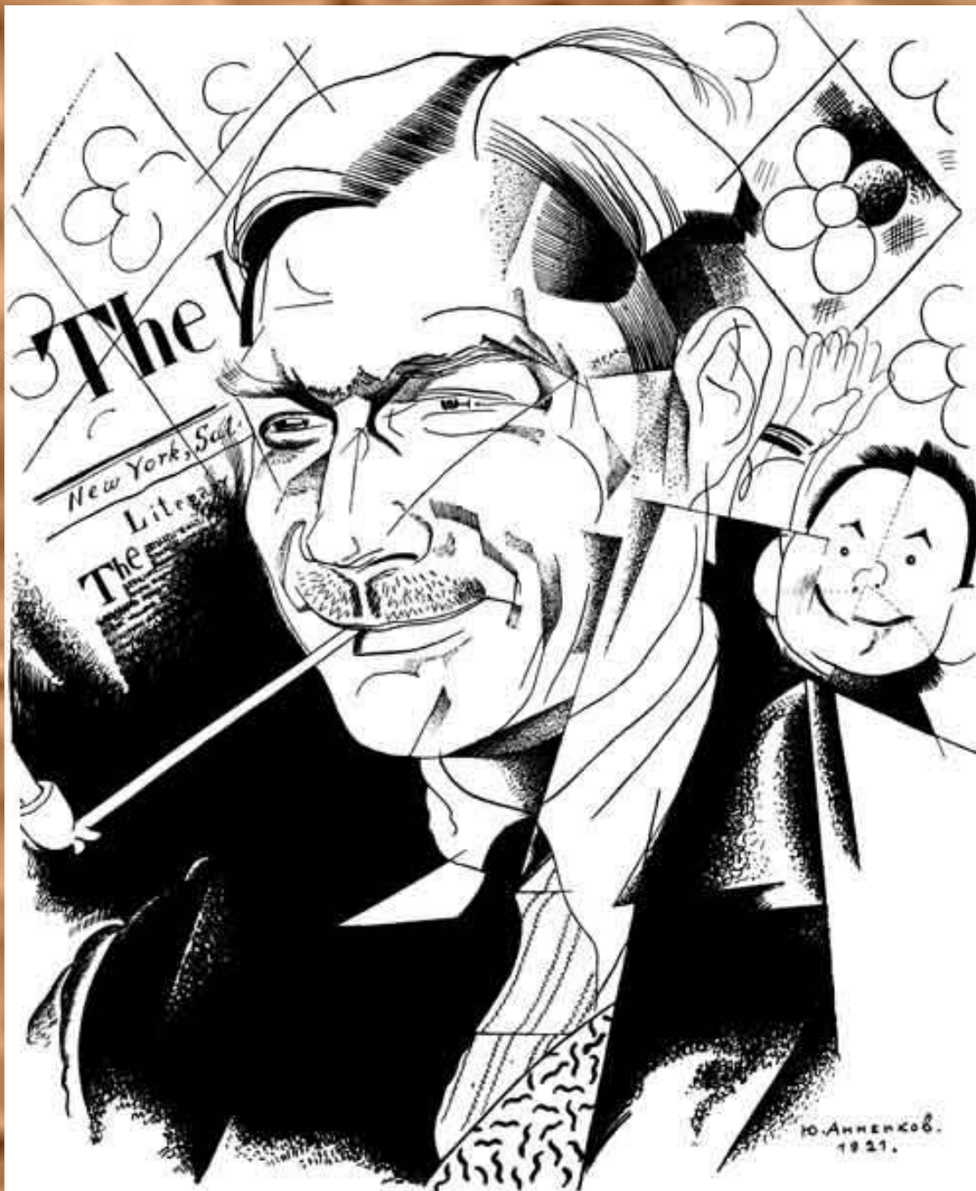
Ю. Анненков. Портрет Евгения Замятина . 1921.