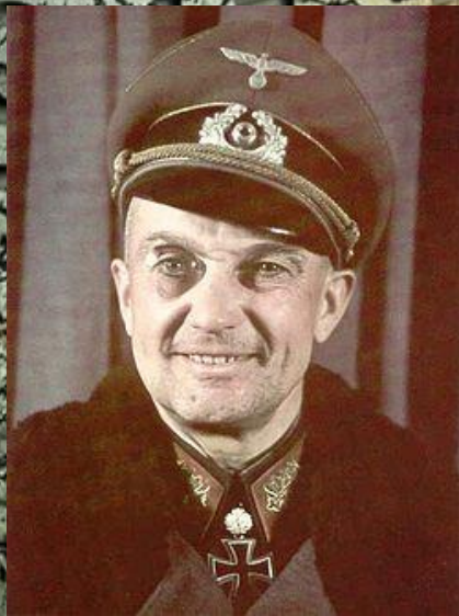
Генерал Герман Гот, командующий 4-й танковой армией, 24-го танкового корпуса и оперативной группой «Кемпф» (группа армий «Юг»)