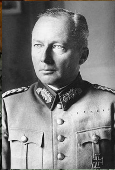
генерал-фельдмаршал Гюнтер Ханс Фон Клюге, группа армий «Центр»