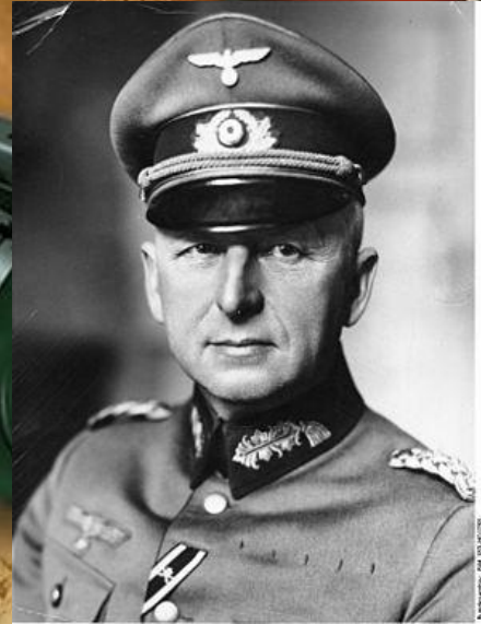
генерал-фельдмаршал Э. Манштейн, группа армий «Юг»