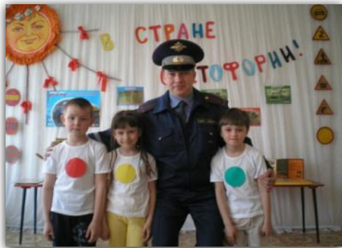
Фото из жизни группы детей