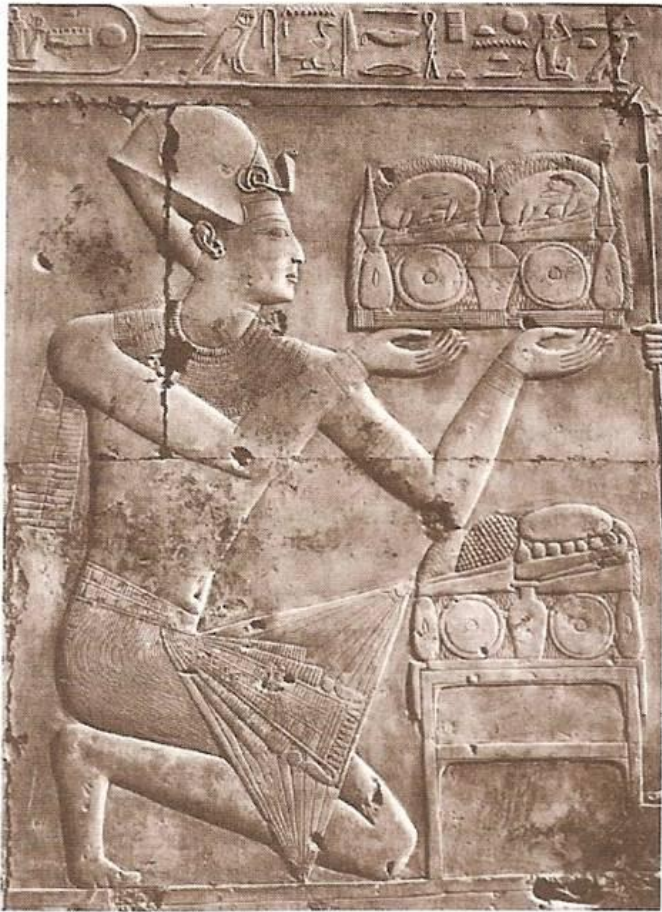
Фараон Сети I . Рельеф в храме в Абидосе.