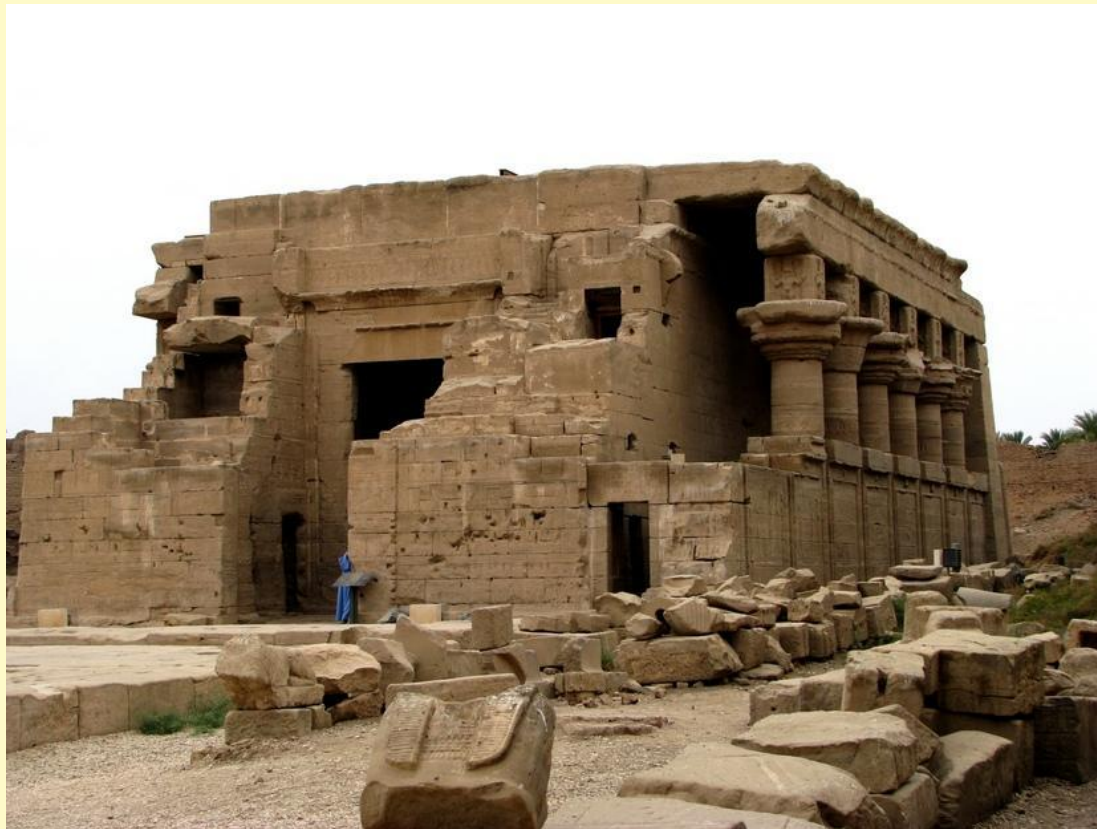
храм в Абидосе. XIV в. до н. э.