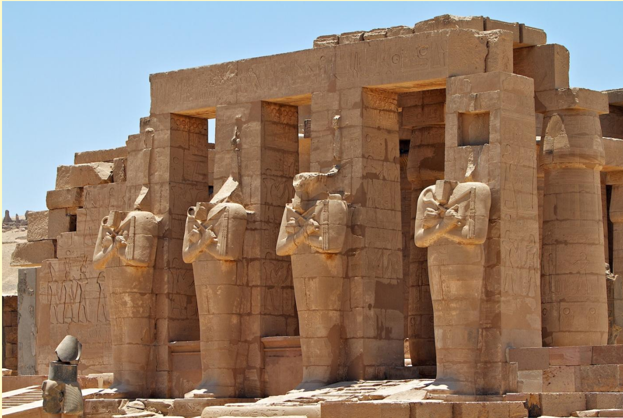
Храм Рамсеса II в Фивах (Рамессеум). XIII в.