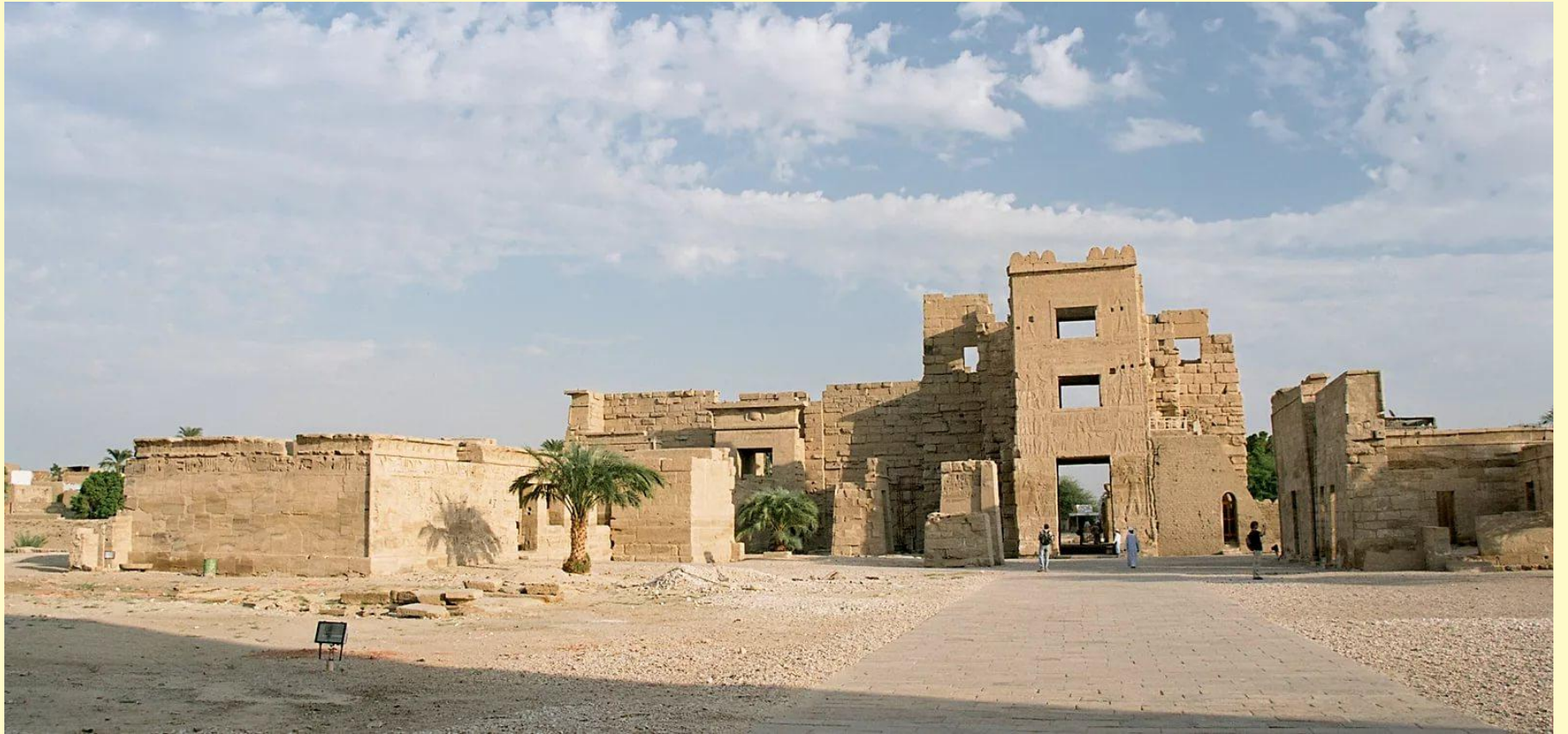
фиванский ансамбль Рамсеса III