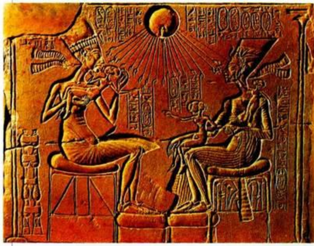
Семья Эхнатона. Рельеф из Амарны. XIV в. до н. э.