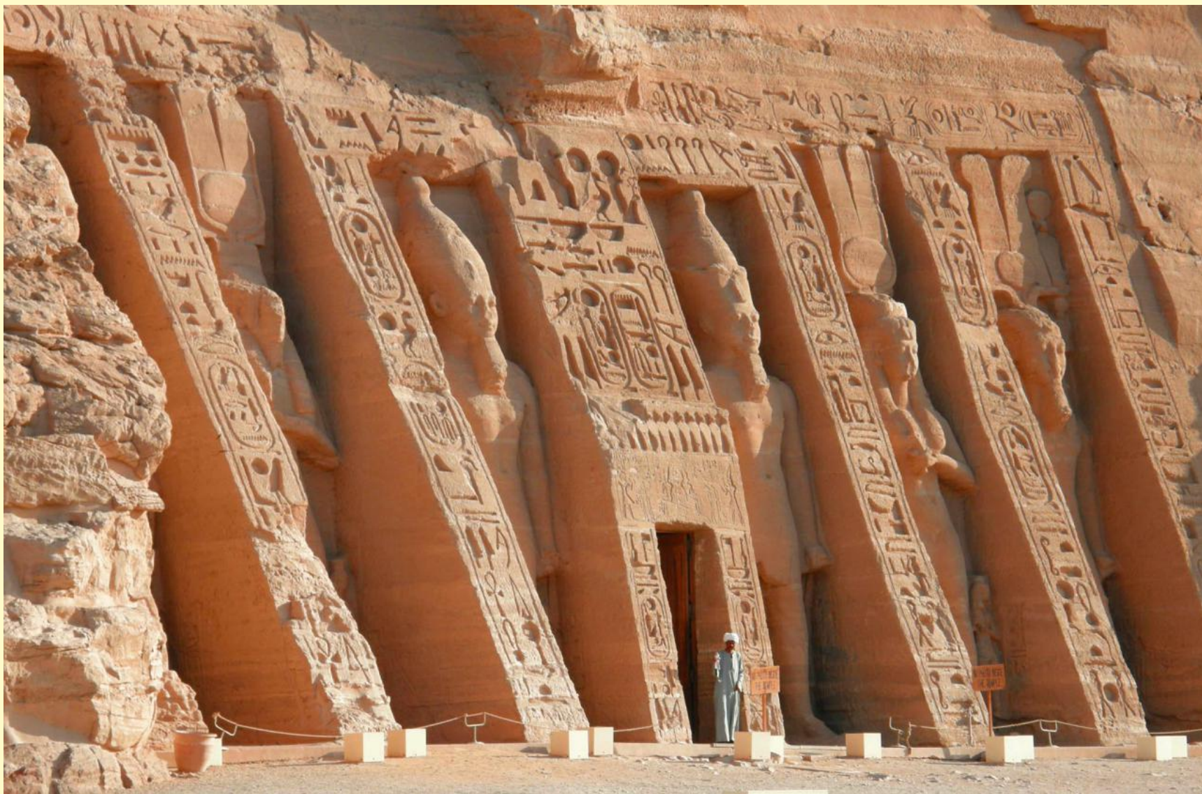
Храм Рамсеса II в Абу-Симбеле. Первая половина XIII в. до н. э.