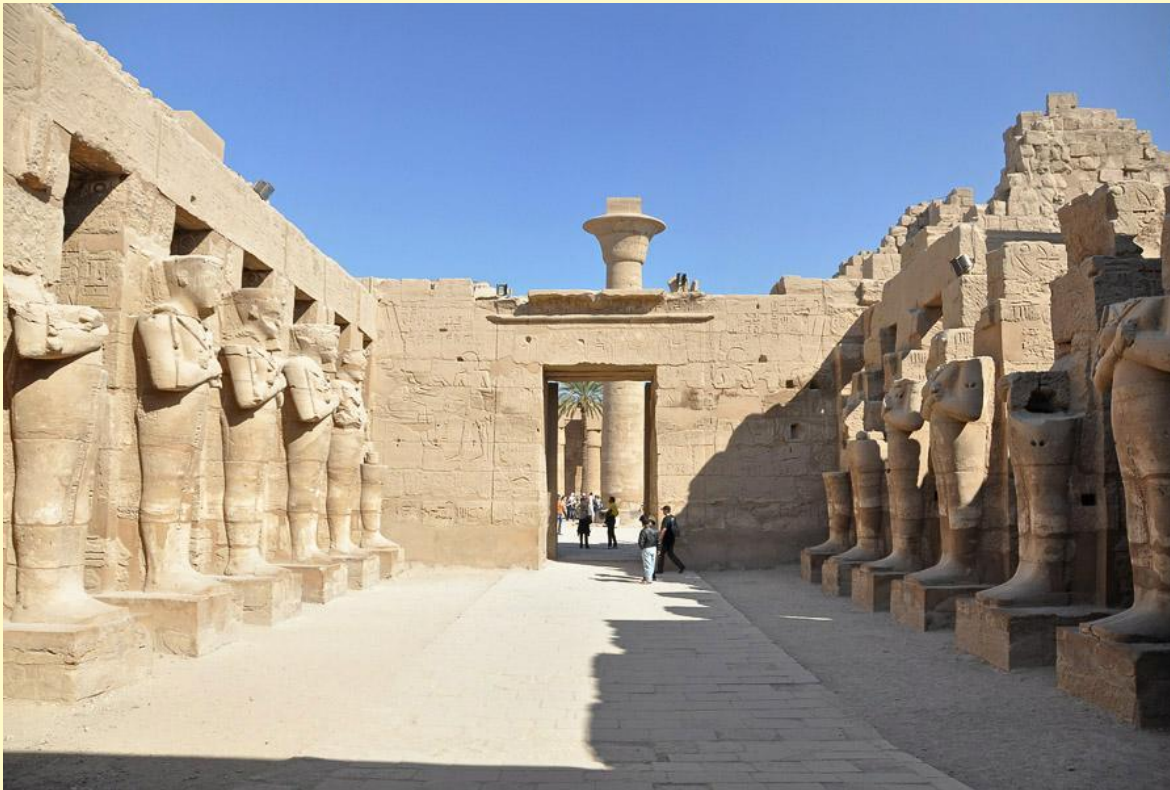
фиванский ансамбль Рамсеса III