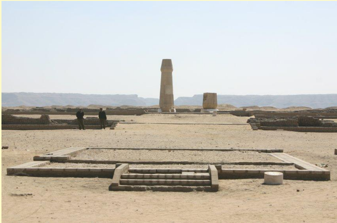
Руины Малого храма Атона в Амарне