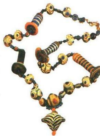
1 Стеклянные бусы. Предмет мас- сового производства у финикийцев