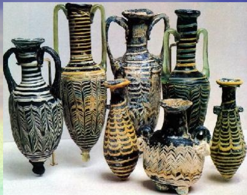
Финикийские амфоры из стекла