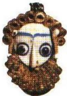
Стеклянный кулон, найденный в Карфагене