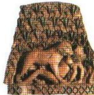
Лев, терзающий нубийца. Резьба по кости