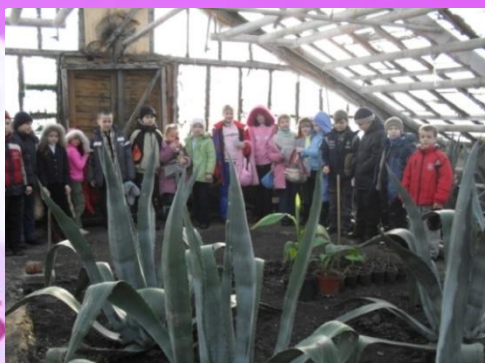
Агава зимует записи