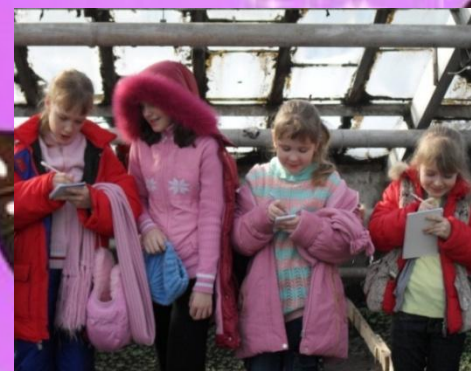
Делаем нужные записи