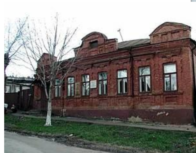
Дом Буниных в Ефремове