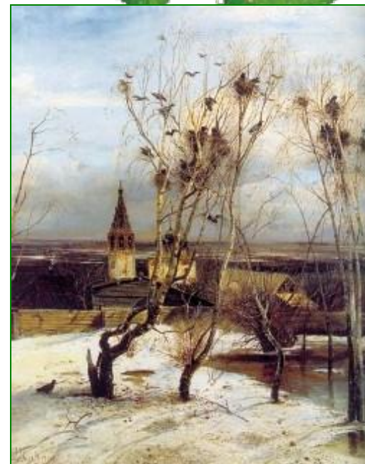
А.Саврасов «Грачи прилетели»