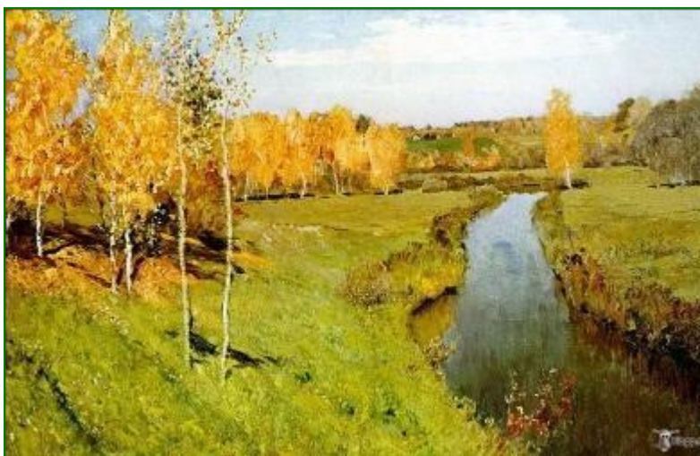
И.Левитан «Золотая осень»