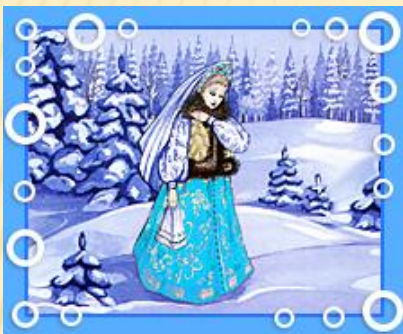
Снегуро чк а