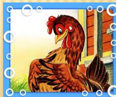
куро чк а Ряба