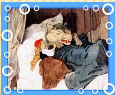
Красная Шапо чк . а