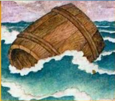
«Сказка о царе Салтане...»

Воспитатель отмечает, что Пушкин написал много сказок и читает детям «Сказку о царе Салтане». Педагог обращает внимание детей на морской сюжет из сказки, на красоту моря и предлагает послушать релаксацию бушующего моря.