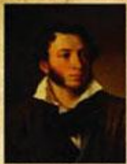
Александр Пушкин 1799-1837