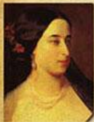
Мария Александровна 1832-1919