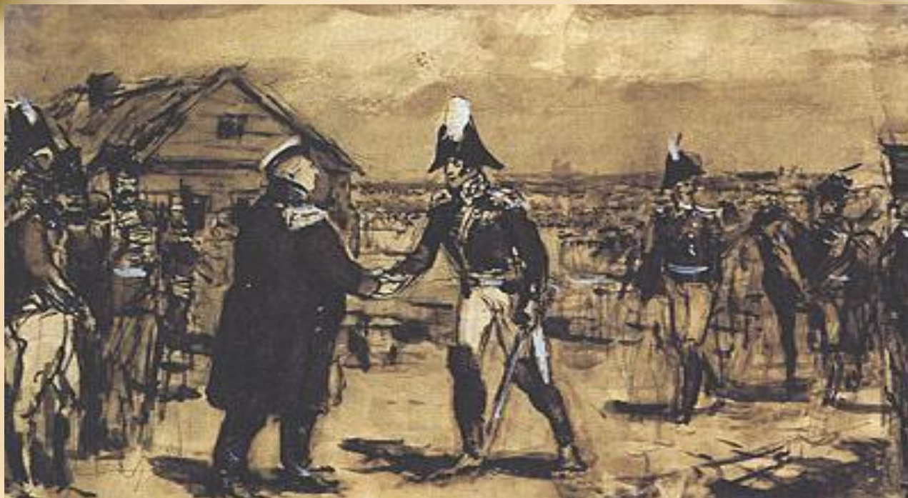
Встреча М.И. Кутузова с П.И. Багратионом под Шенграбеном